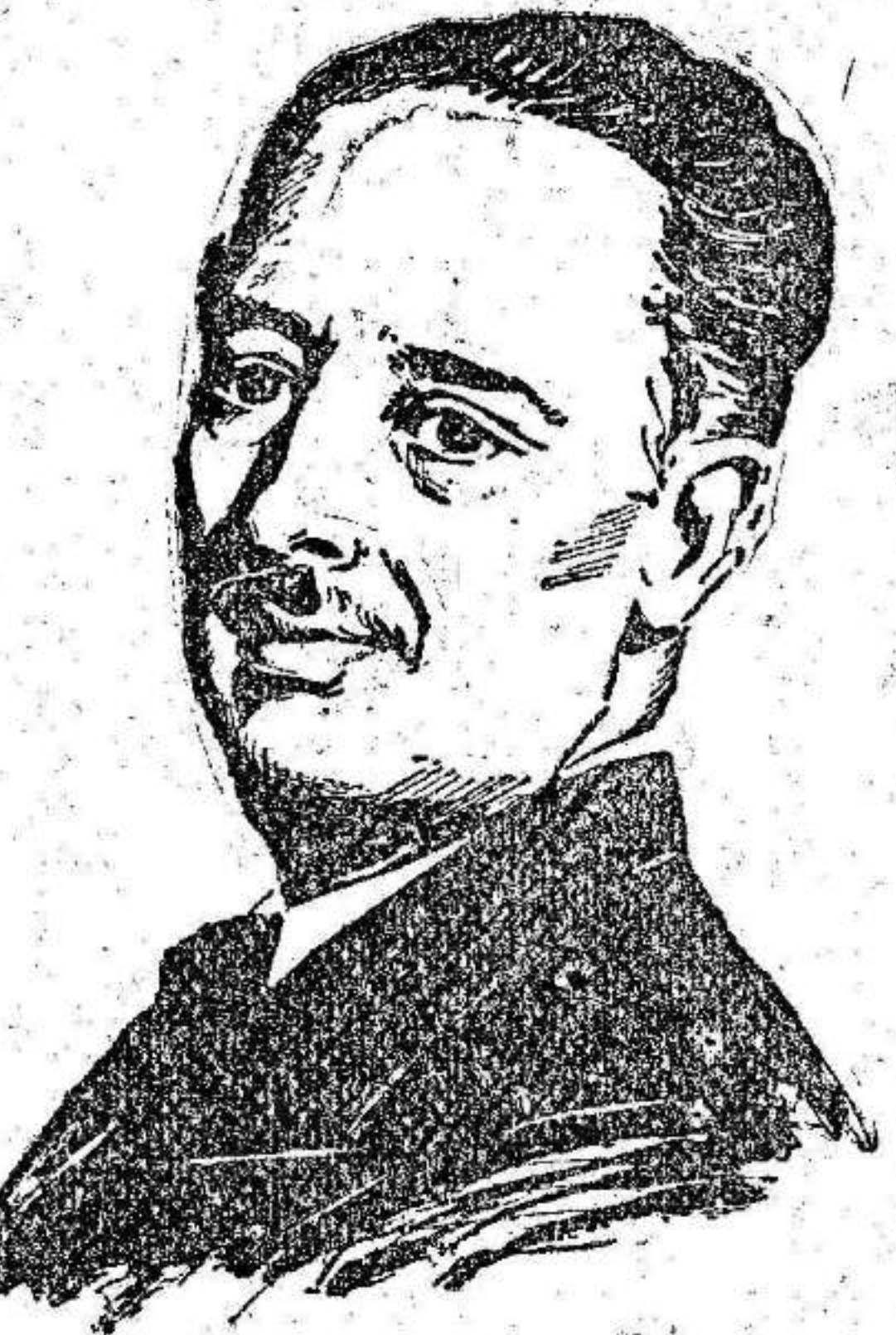
El Presidente de la Generalitat, Luis Companys

Claro, que lo primero es que las mujeres se en cuenta de que su deber, lo que necesita la Causa, no es el estarse ellas por ahí, en la calle o de tertulia, perdiendo el tiempo.