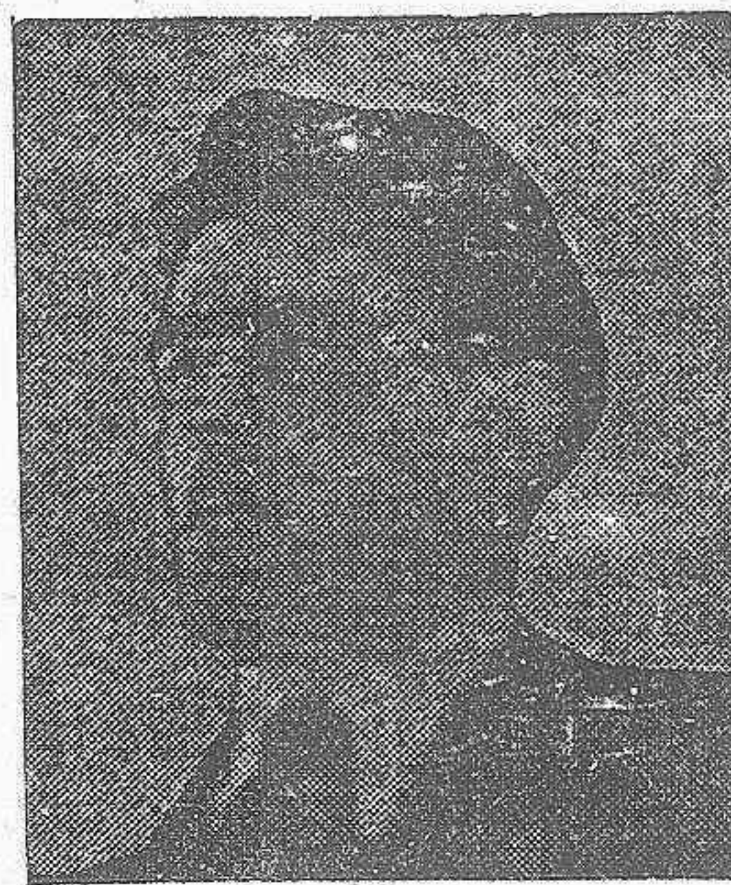
JOSE DIAZ Secretario general del Comité Central del Partido Comunista de España.