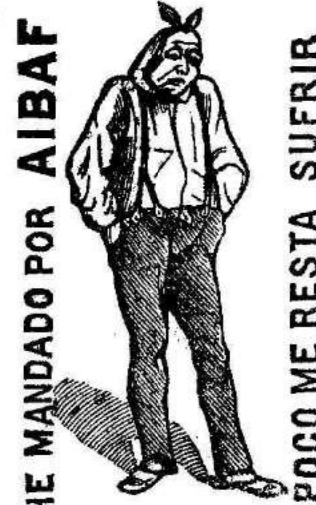
HE MANDADO POR AIBAF