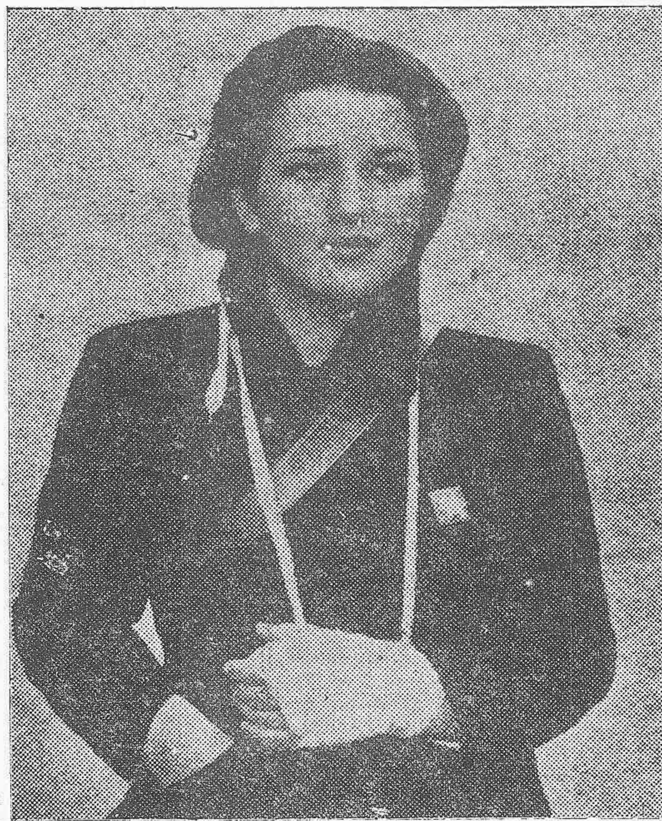
UNA MILICIANA GUAPA Y VALIENTE