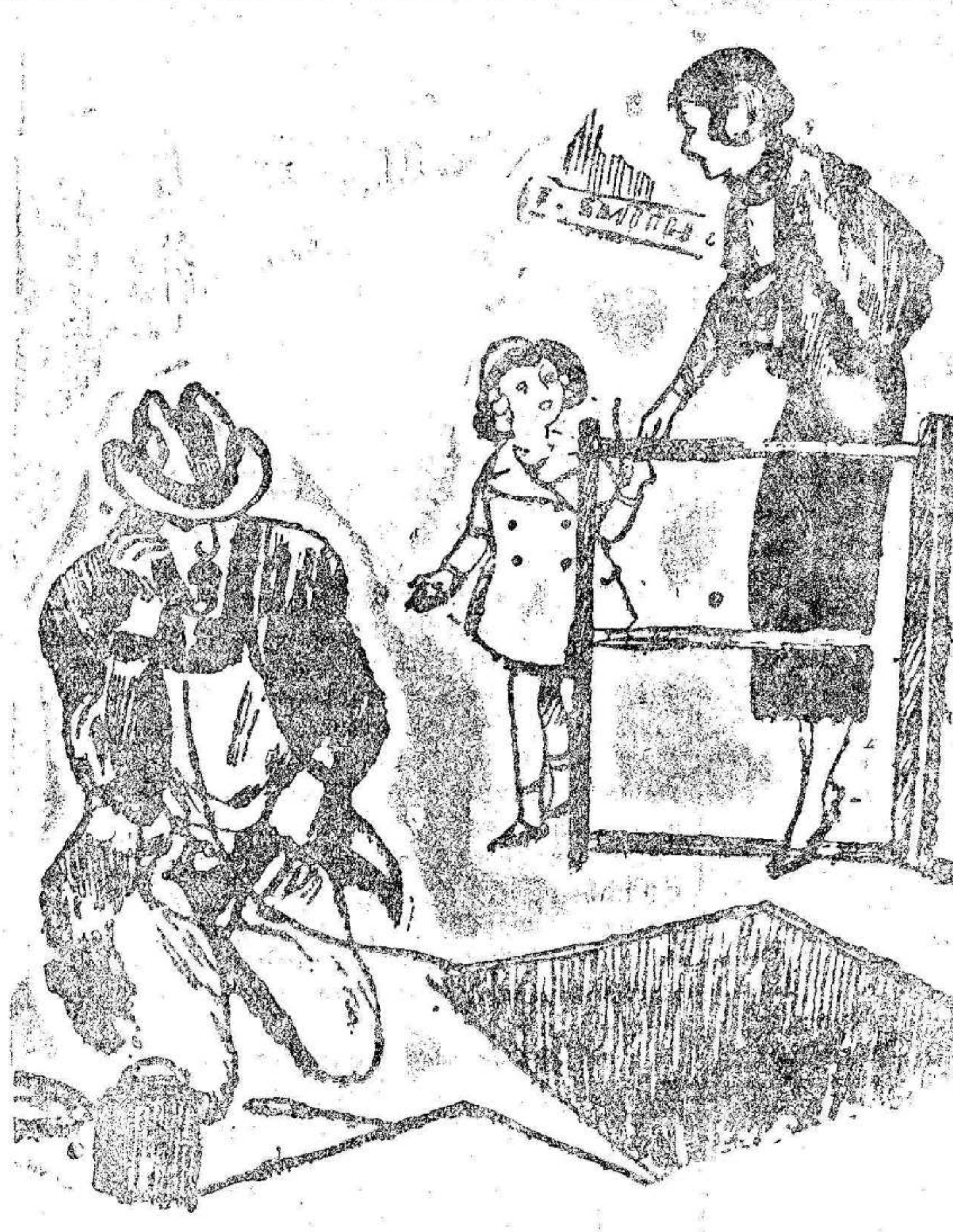
—Mamá, ¿está ese señor hablando por teléfono con Sataná?

ALBACETE. Kiosco Morrer. Paseo de Alfonso XII. VALENCIA. Kiosco Río de la Plata, calle Barcas, 6.