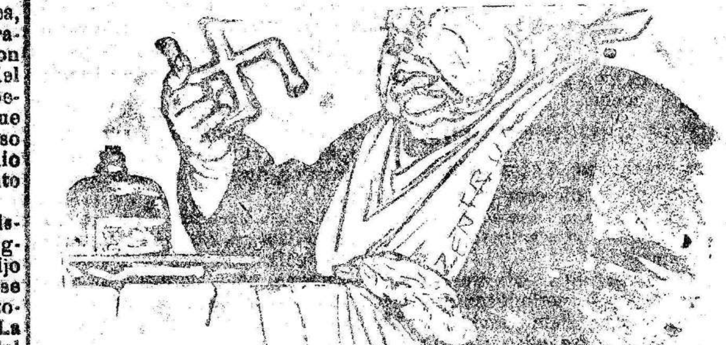
SE LO TRAGARA AL FIN? El católico alemán.—Tengo buen estómago; pero no puedo tragarme esto!