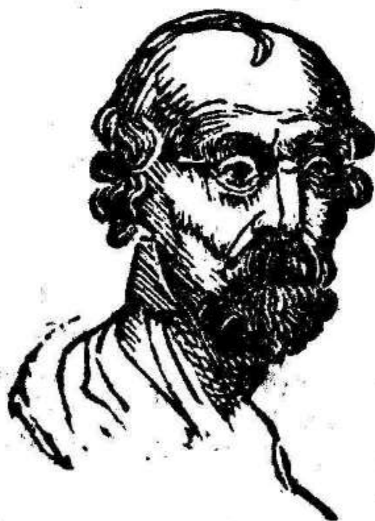
PEDRO I.º CZAR DE RUSIA (LLAMADO EL GRANDE) SU HIJO ALIXIS Y SU ESPOSA CATALINA.

La Rusia en el seno de la barbarie mas grosera, produjo uno de aquellos hombres extraordinarios, que nacen para cambiar en un todo la faz de las nacio-