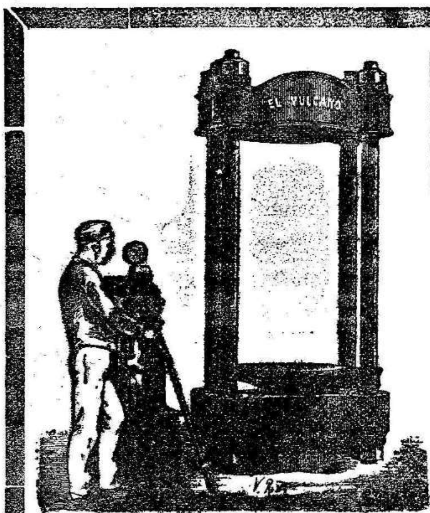
OFICINAS: P. PELOTA, 6. TALLERES: C. ORILLA DEL RIO, 16.

Cok á 8 reales el quintal en la fábrica de gas.