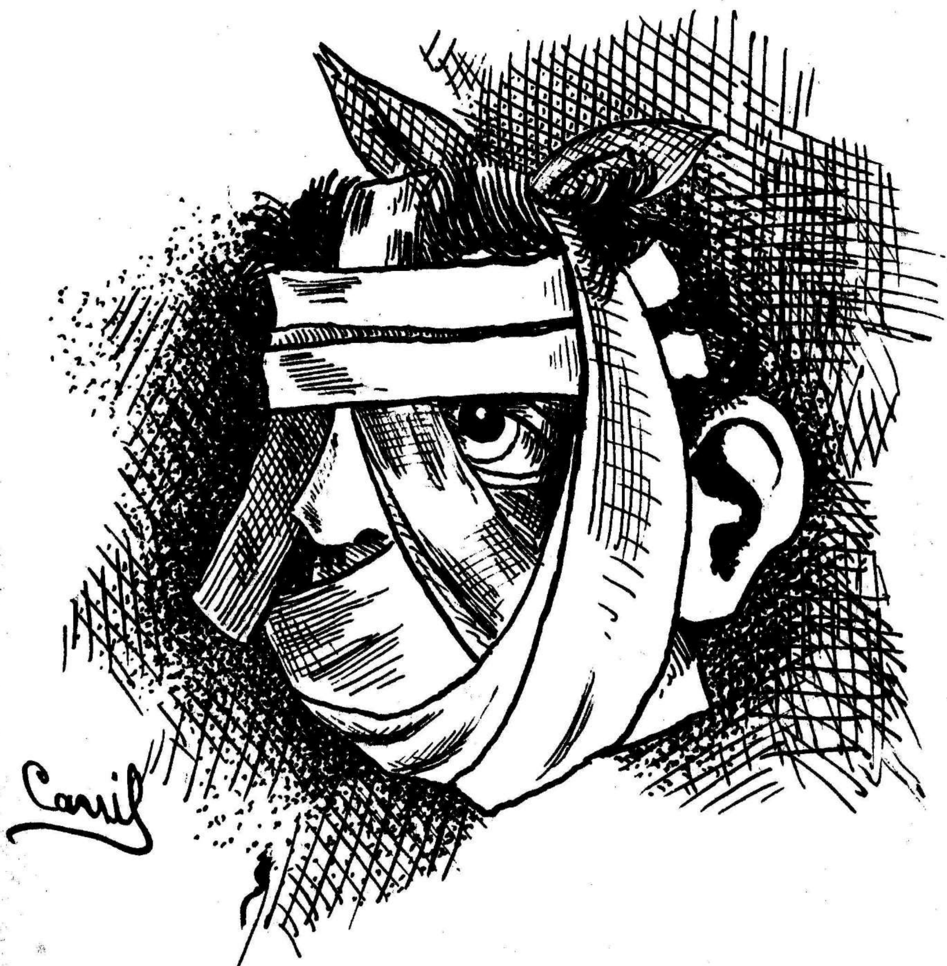
Cabeza de un corista del Romea despues de un exito.....de patatas.