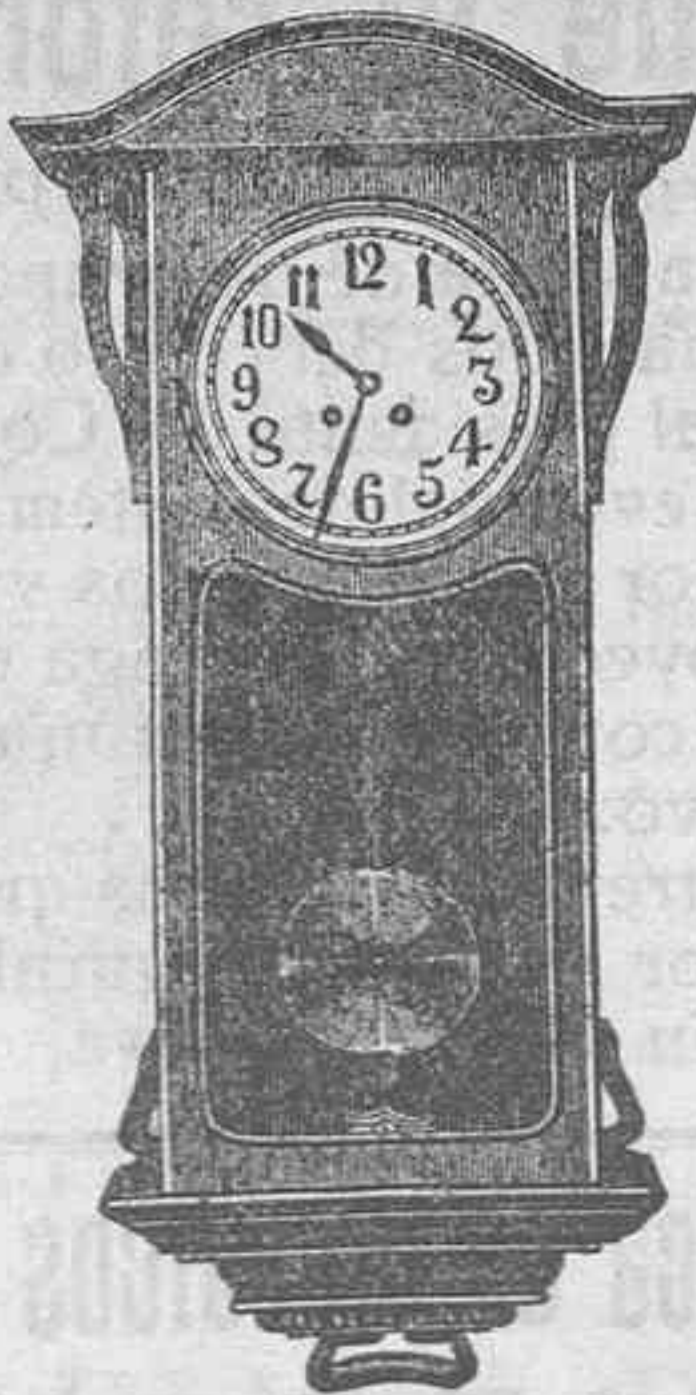
Reloj de pared con campana y cuerda para 15 días