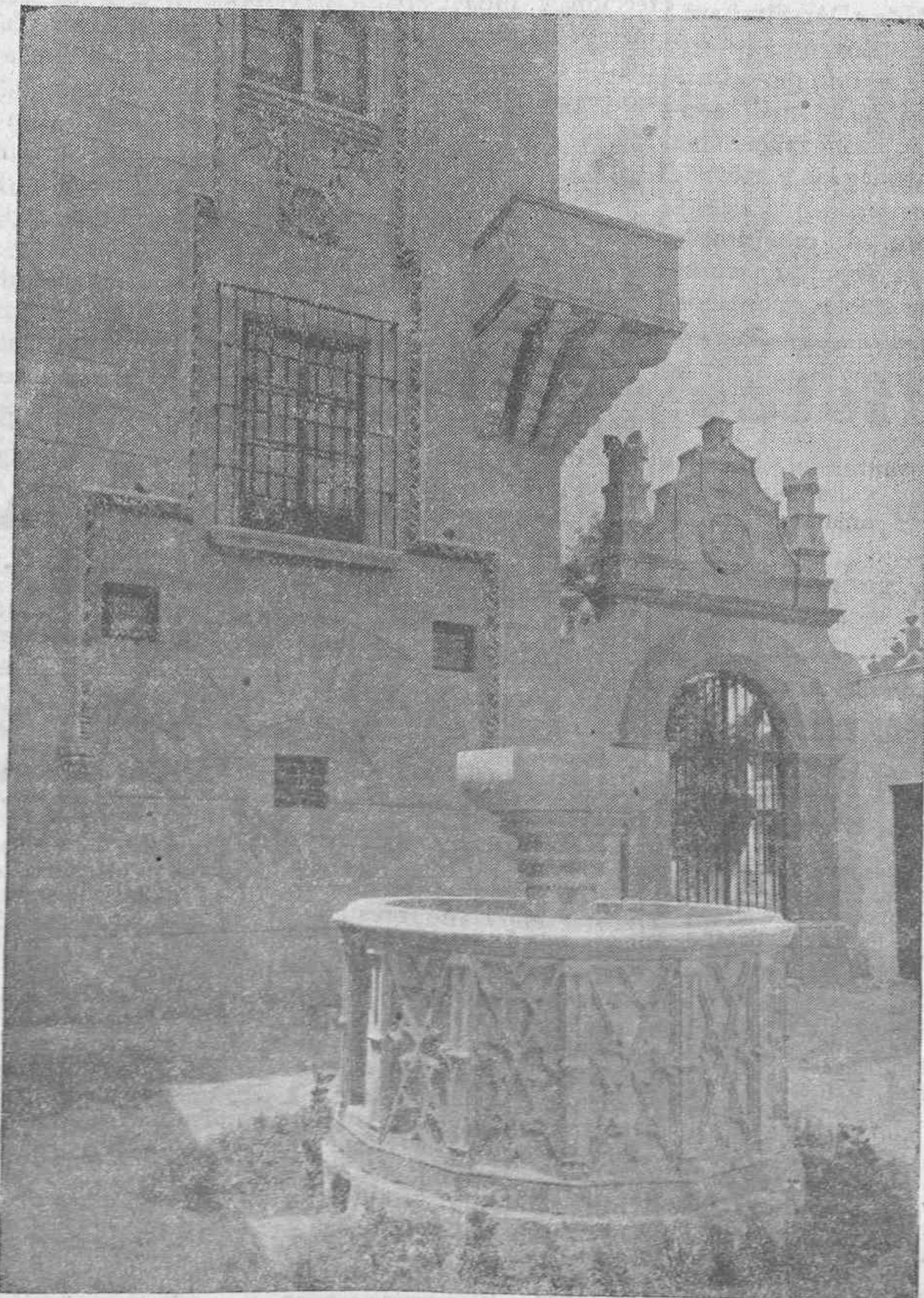
Un detalle del Pabellón de Extremadura