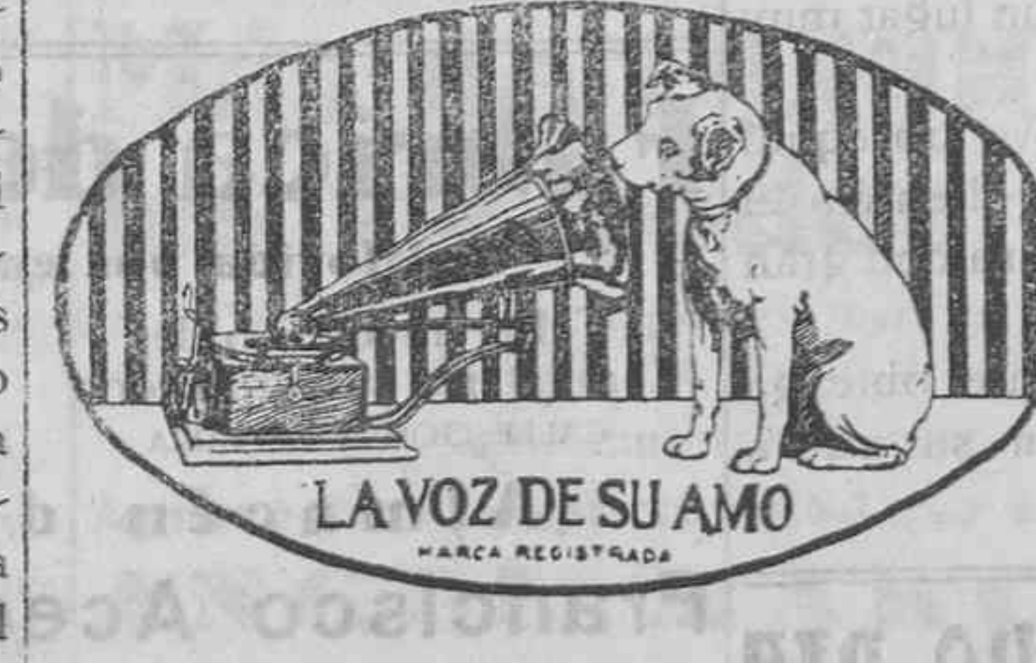
LA VOZ DE SU AMO MARCA REGISTRADA

Relojes Longines, Omega, Cyma, Roscoff, etc., etc.