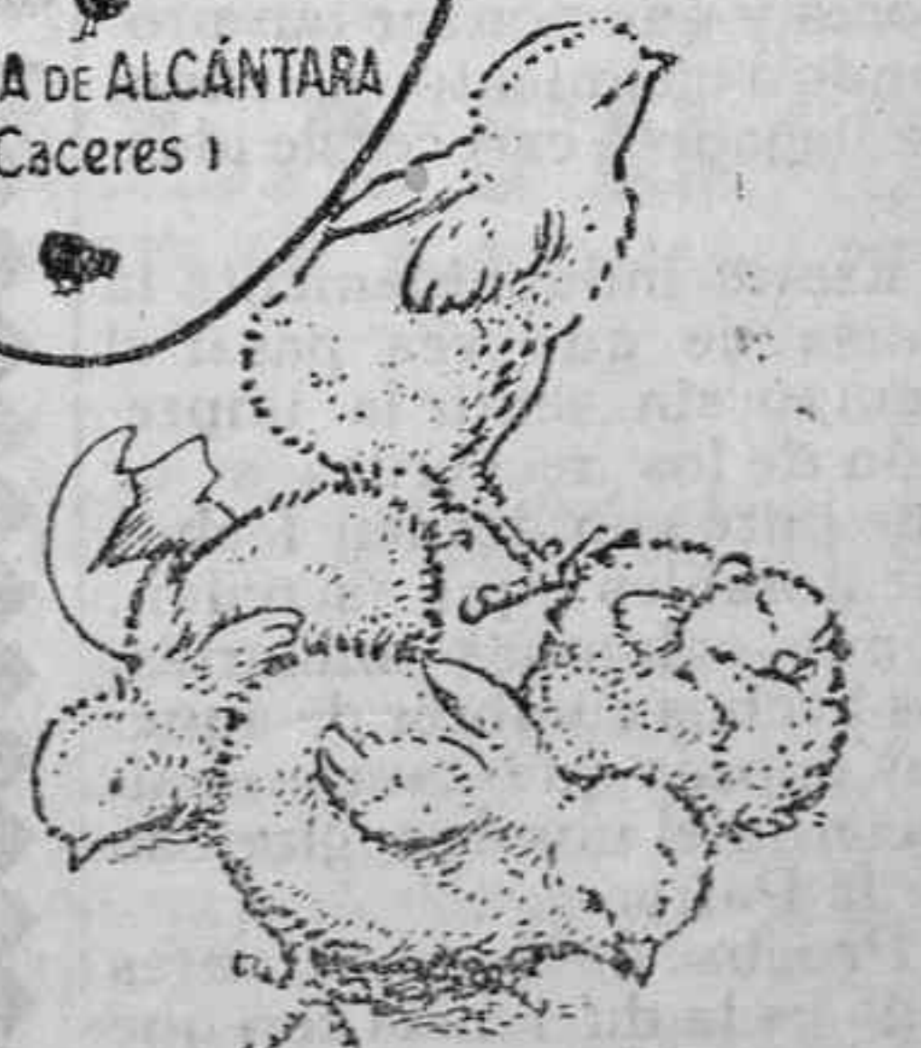
Polluelos recién nacidos