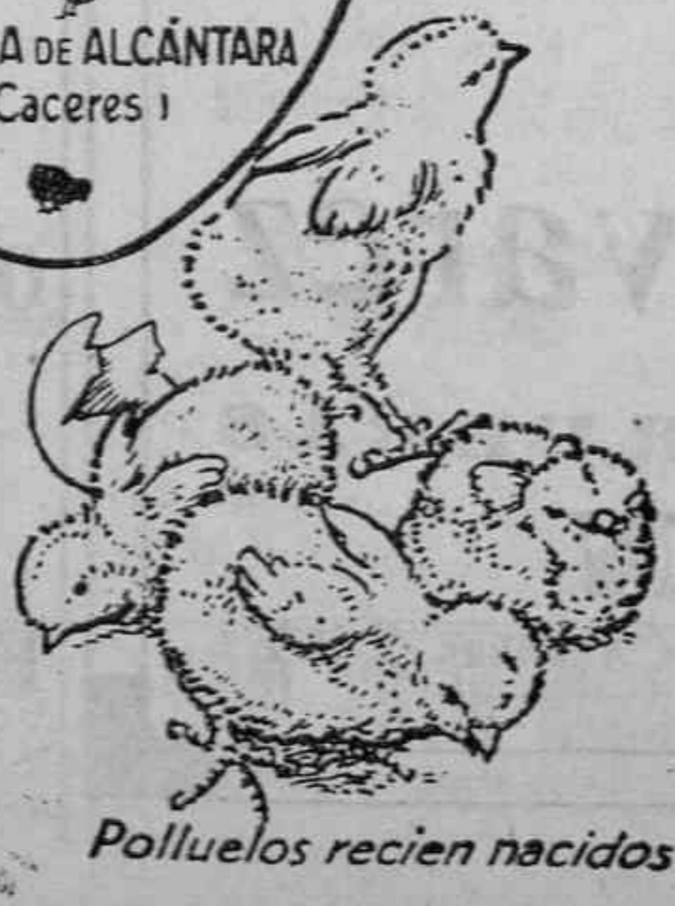
Polluelos recién nacidos