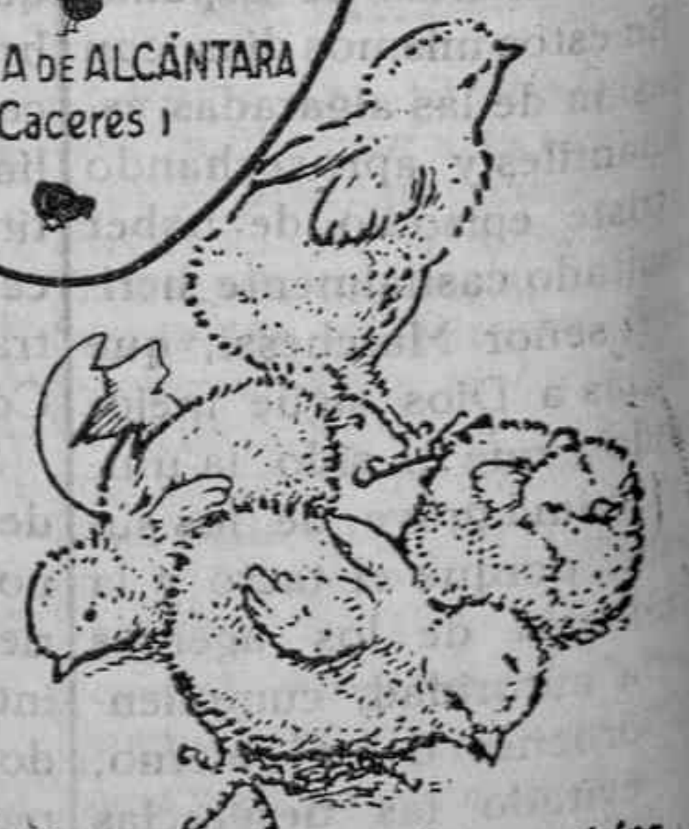
Polluelos recién nacidos