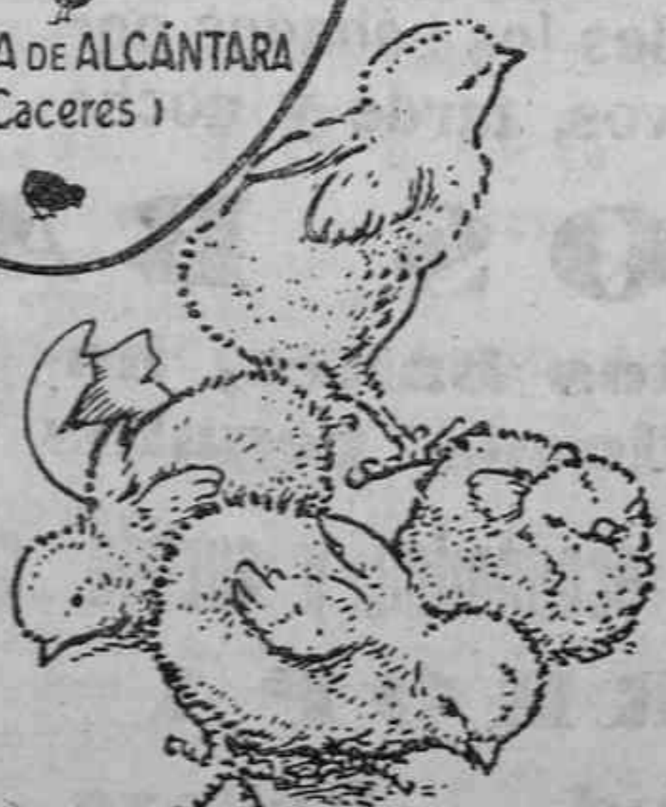
Polluelos recién nacidos