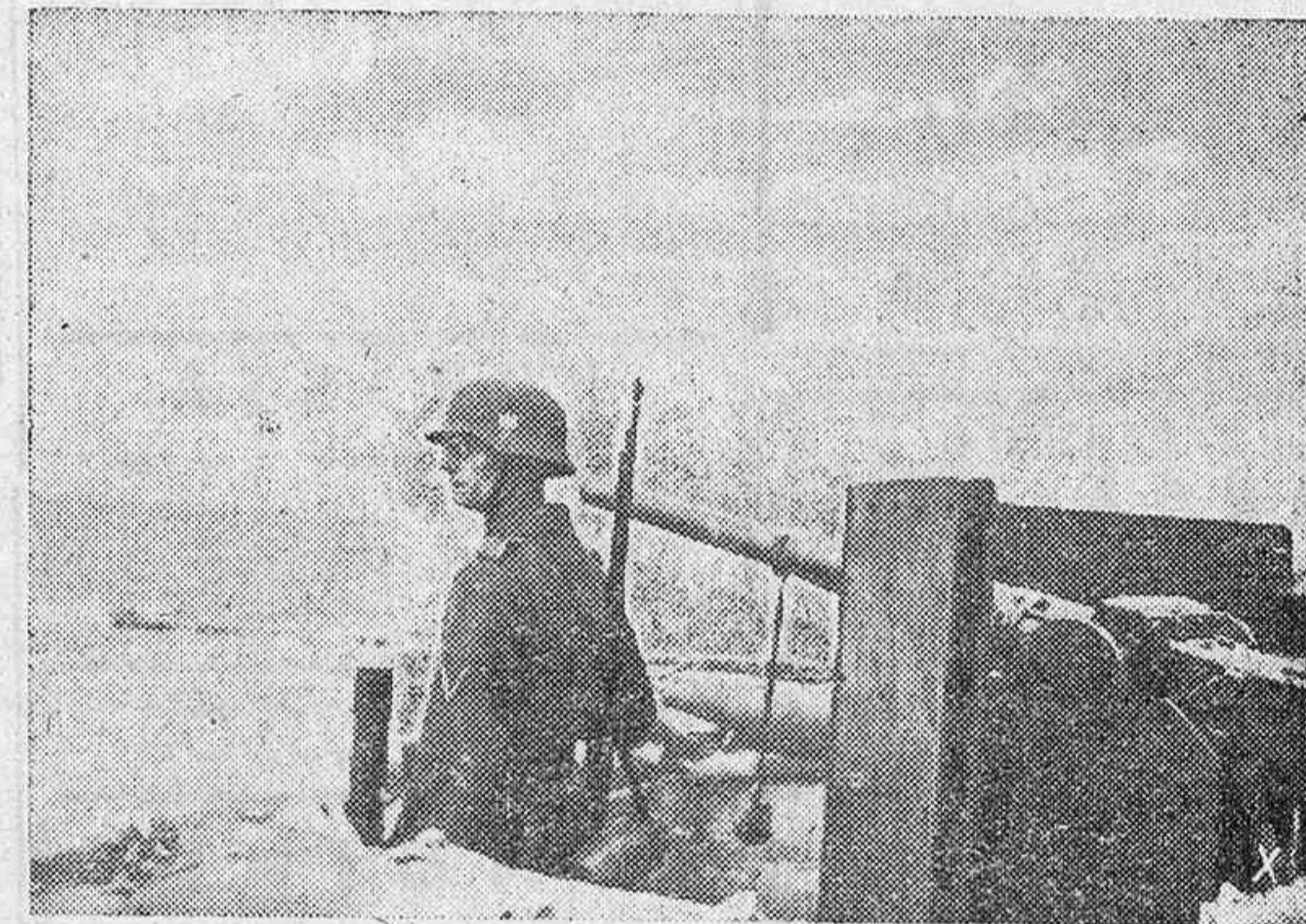
Firme el ademán del centinela en su puesto de vigilancia ante la invencible barrera de la costa del Canal.