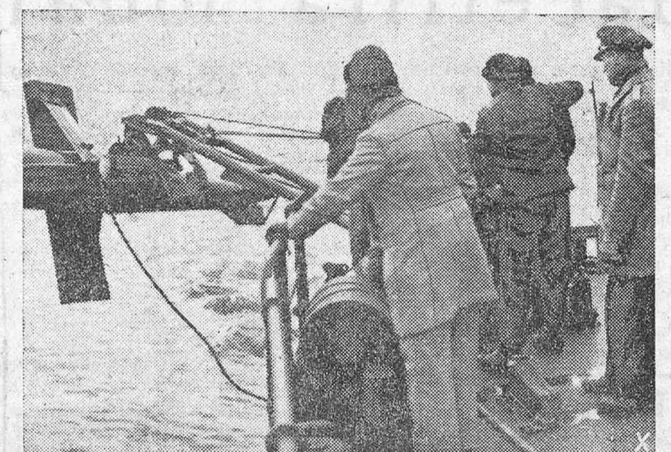
Buscaminas alemán en trabajo de inspección en las costas finlandesas.

Berlin.—Las cifras de las pérdidas ocasionadas a las fuerzas aéreas anglo-norteamericanas, anuncia la agencia DNB, aumentan constantemente. En las numerosas incursiones sobre los territorios del Reich y del Oeste el enemigo ha perdido 500 aviones en los 25 primeros días del mes de junio. Estas cifras equivalen a seis escuadras de combate y a unos 6.000 pilotos, con una instrucción prolongada.—Efe.