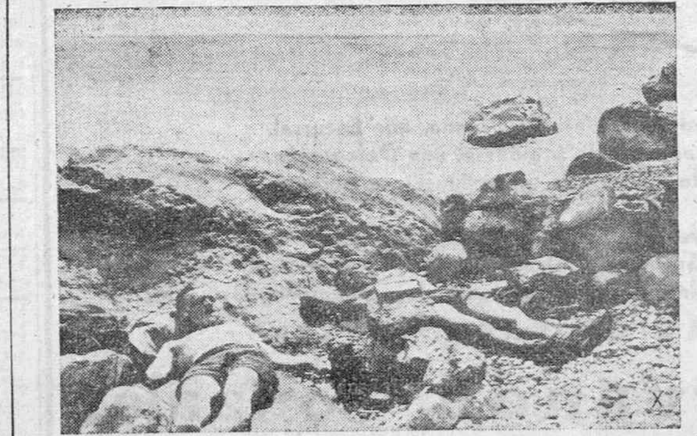
En las horas libres, los soldados alemanes que prestan sus servicios en las costas del mar Negro, aprovechan para tomar el sol.