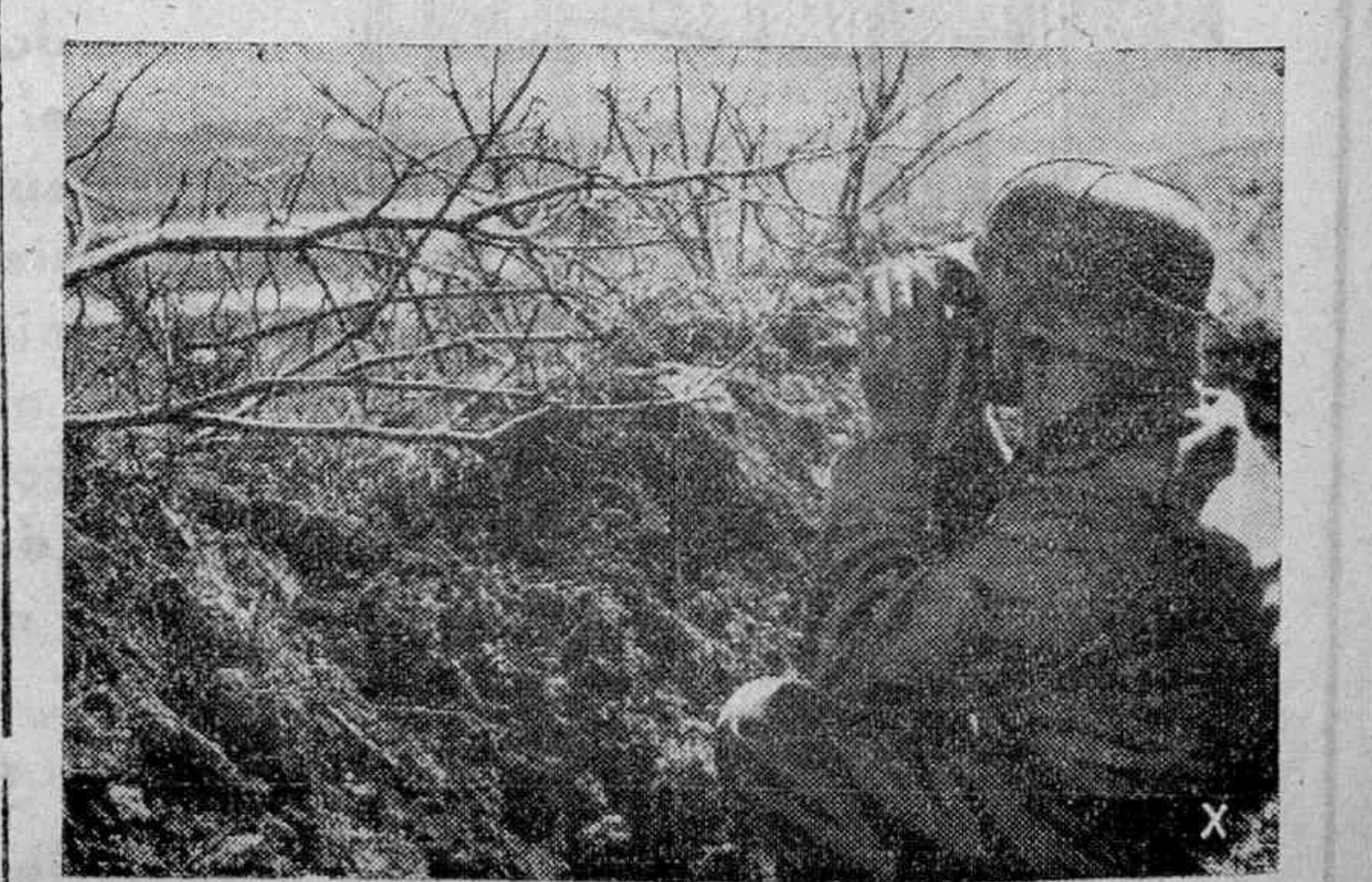
La guerra en el frente del Donetz. Soldado alemán desde su puesto de observación, mira con sus prismáticos la otra orilla del río Donetz para vigilar los movimientos del enemigo.