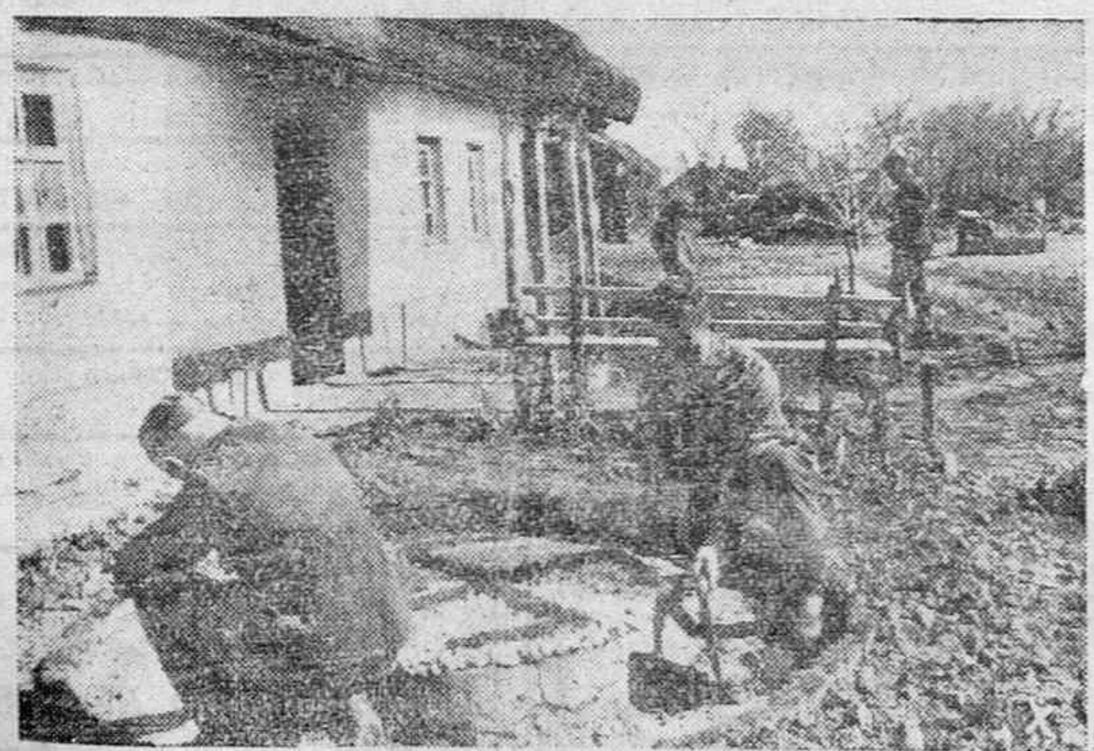
En las horas libres que tienen estos soldados alemanes se ocupan de la limpieza y adorno de sus alojamientos.