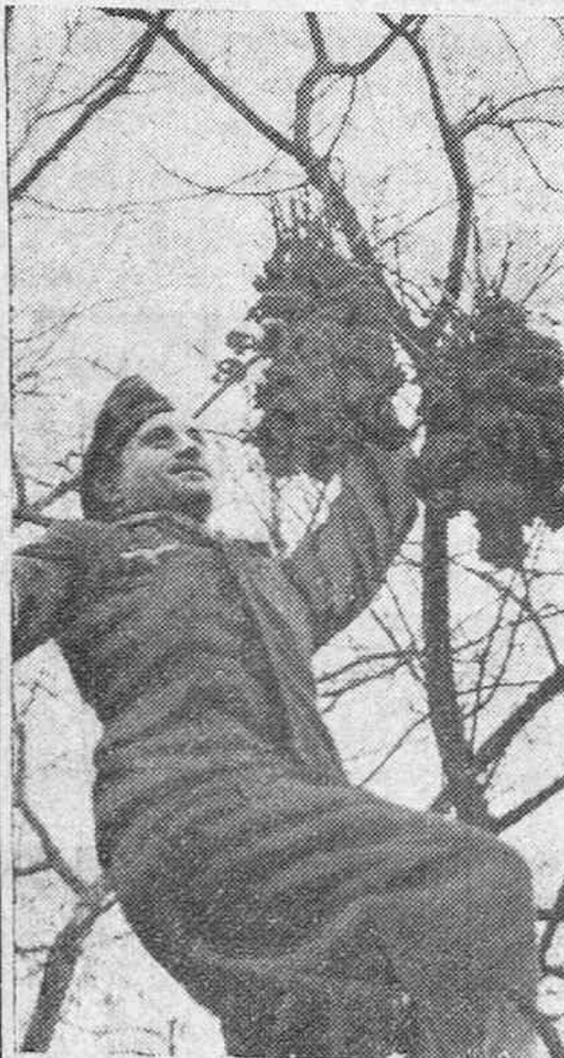
Desde lo alto de un árbol, el observador aprecia el resultado de los tiros de su artillería.