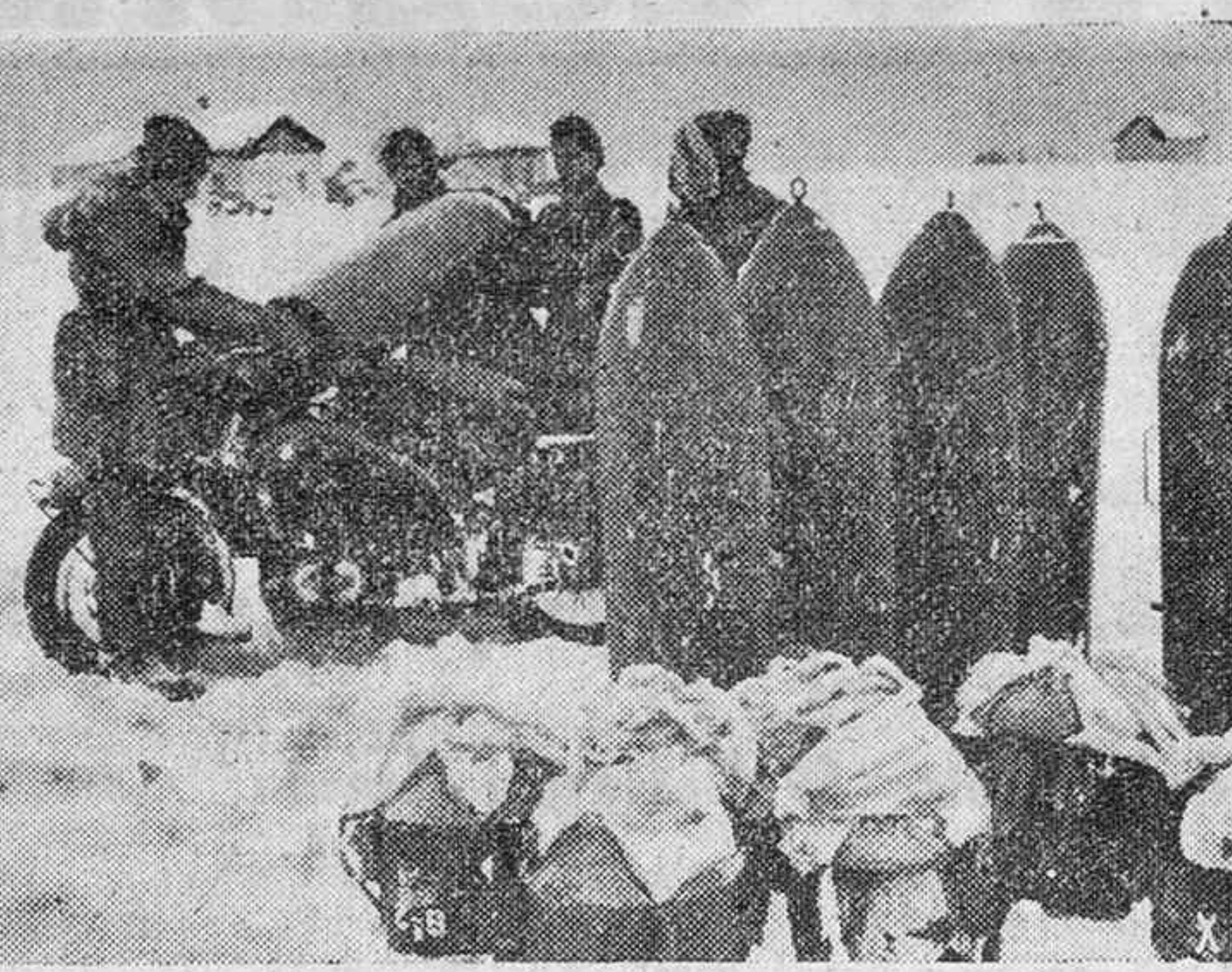
Una motocicleta transporta las bombas y los paracaídas al sitio previsto, próximo al aeródromo.