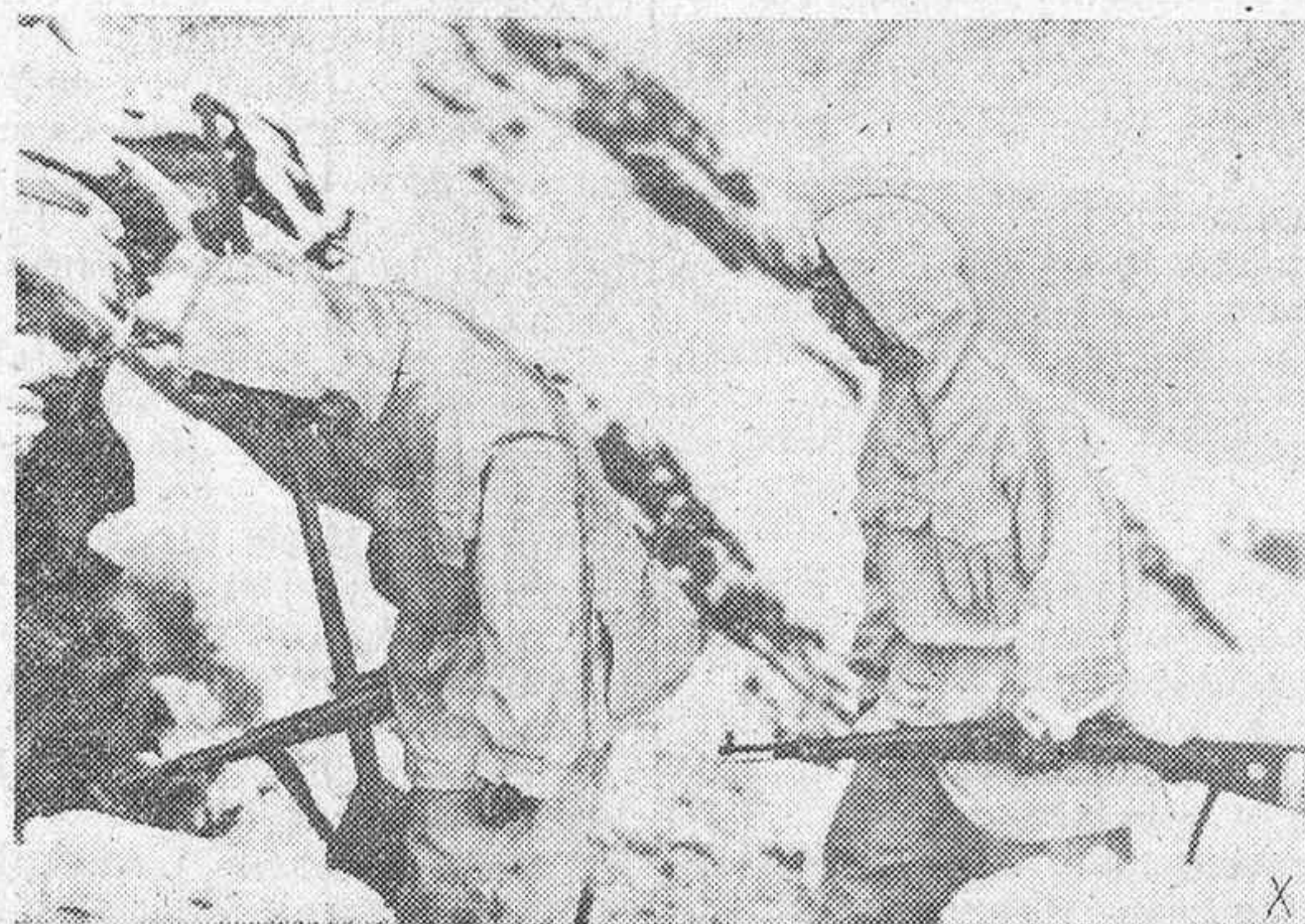
Aún cubren las nieves estos sectores más septentrionales y por entre obstáculos los soldados pasan con sus armamentos a cues tas.

La iniciativa bélica ha pasado ahora al Reich en el Frente Oriental