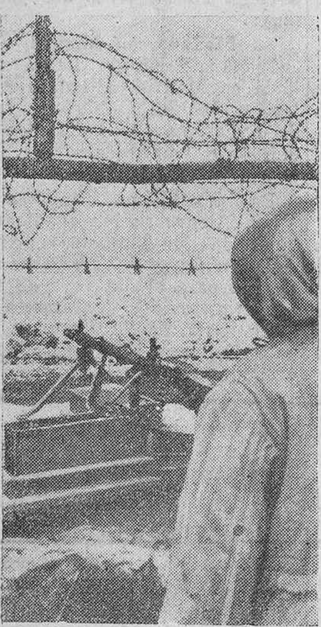
Protegiendo las alambradas, las primeras máquinas y piezas automáticas