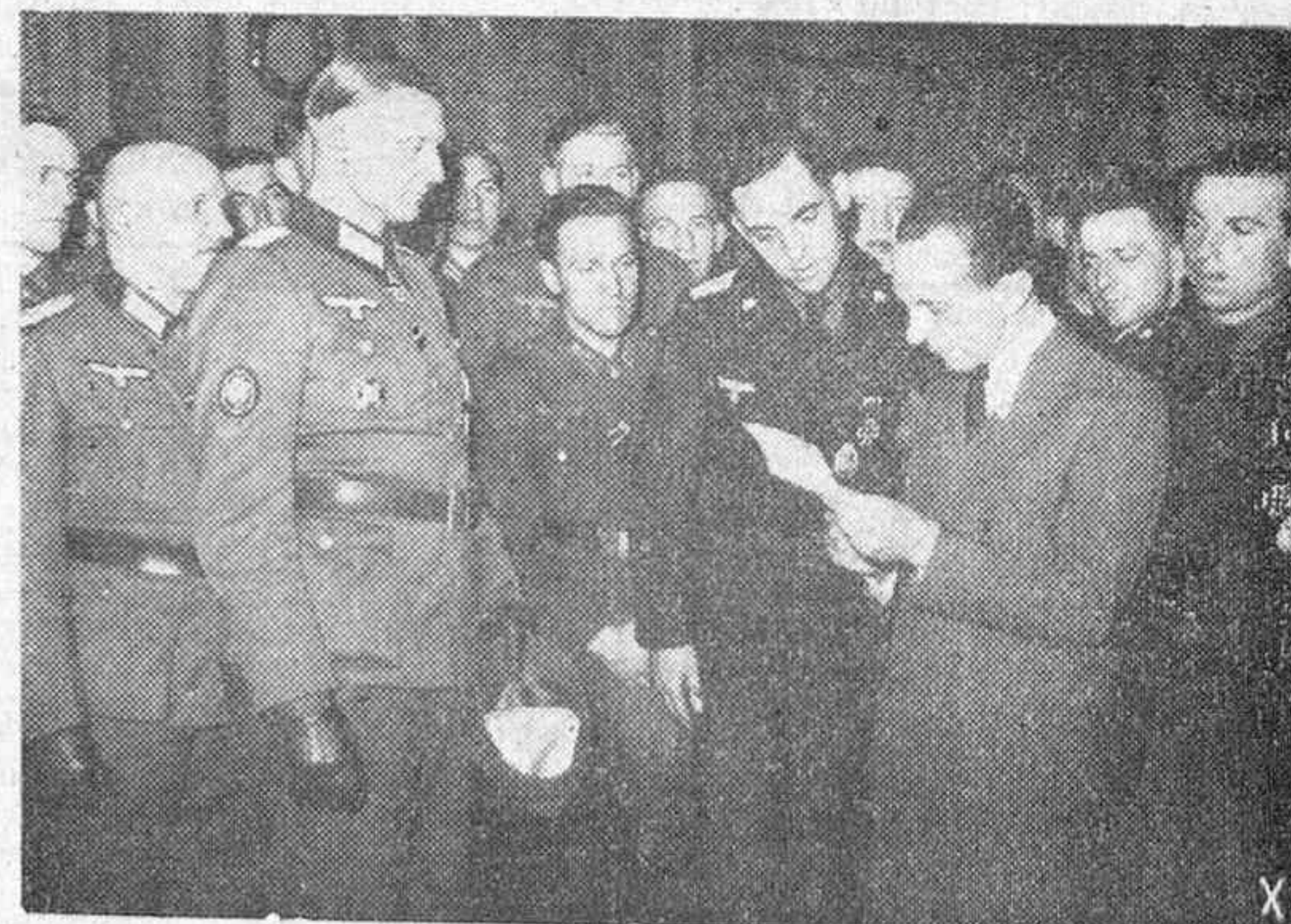
El ministro de Propaganda del Reich, Dr. Goebbels, con unos soldados de la aviación germana, los que muestran al mismo las fotografías obtenidas en sus vuelos.