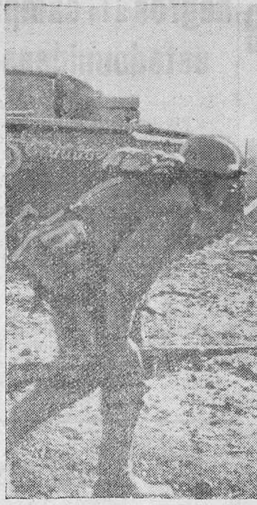
Siempre al lado del tanque, la Infantería, que se cubre con sus disparos.

¿Cómo decorar tu casa? ¿Cómo convertir en nuevo el traje pasado de moda? ¿Cómo ir vestido al día? Mujer, lee MEDINA.