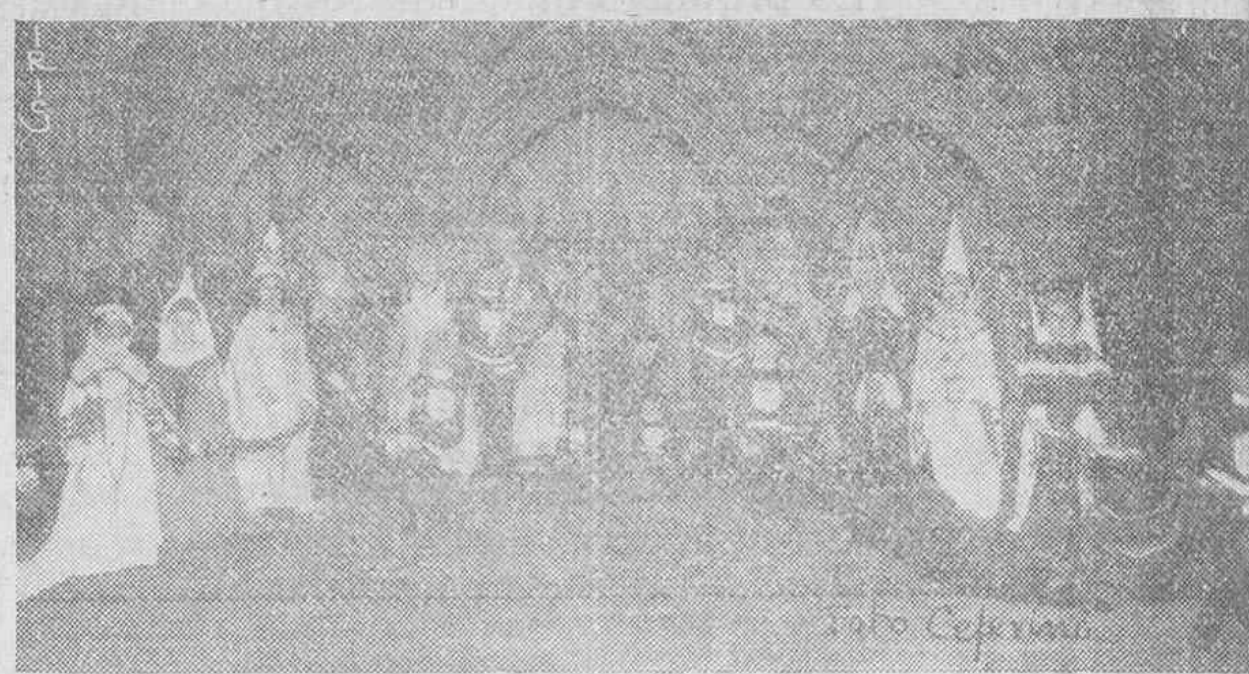
VI CENTENARIO DEL CANCELLER Y ALCALDE MAYOR DE CASTILLA DON PERD LOPEZ DE AYALA.—APOTEOSIS FINAL