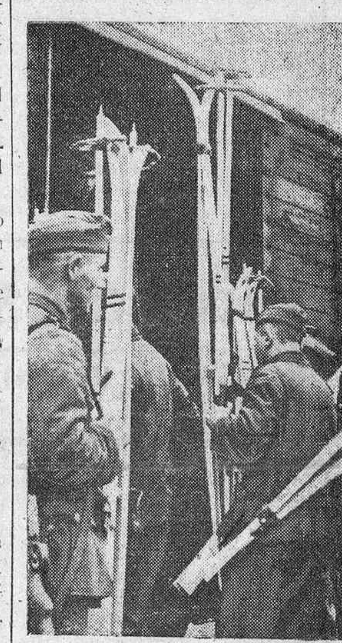
Nuevos grupos de soldados alemanes esquiadores salen para el frente, donde sus servicios son tan apreciados.

Cupón's Banco de Bilbao, 115. Hidroeléctrica Ibérica, 66. Babeon-Willeox, 75. Azucarera de España, 450.