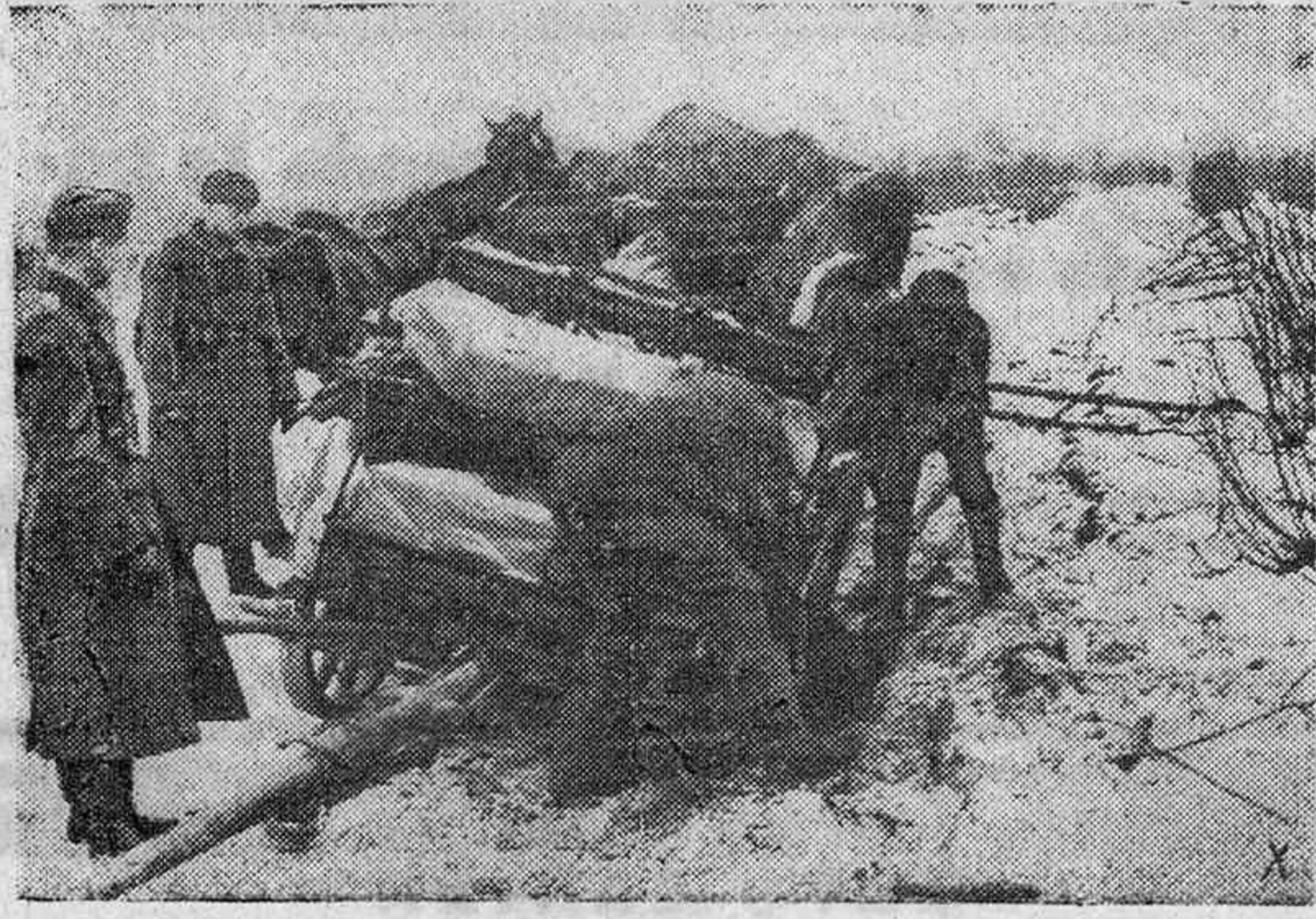
La costra helada ha engañado a los soldados alemanes en el transporte de un arma pesada de campaña. Aquellos hacen esfuerzos para sacar del hoyo la pieza.