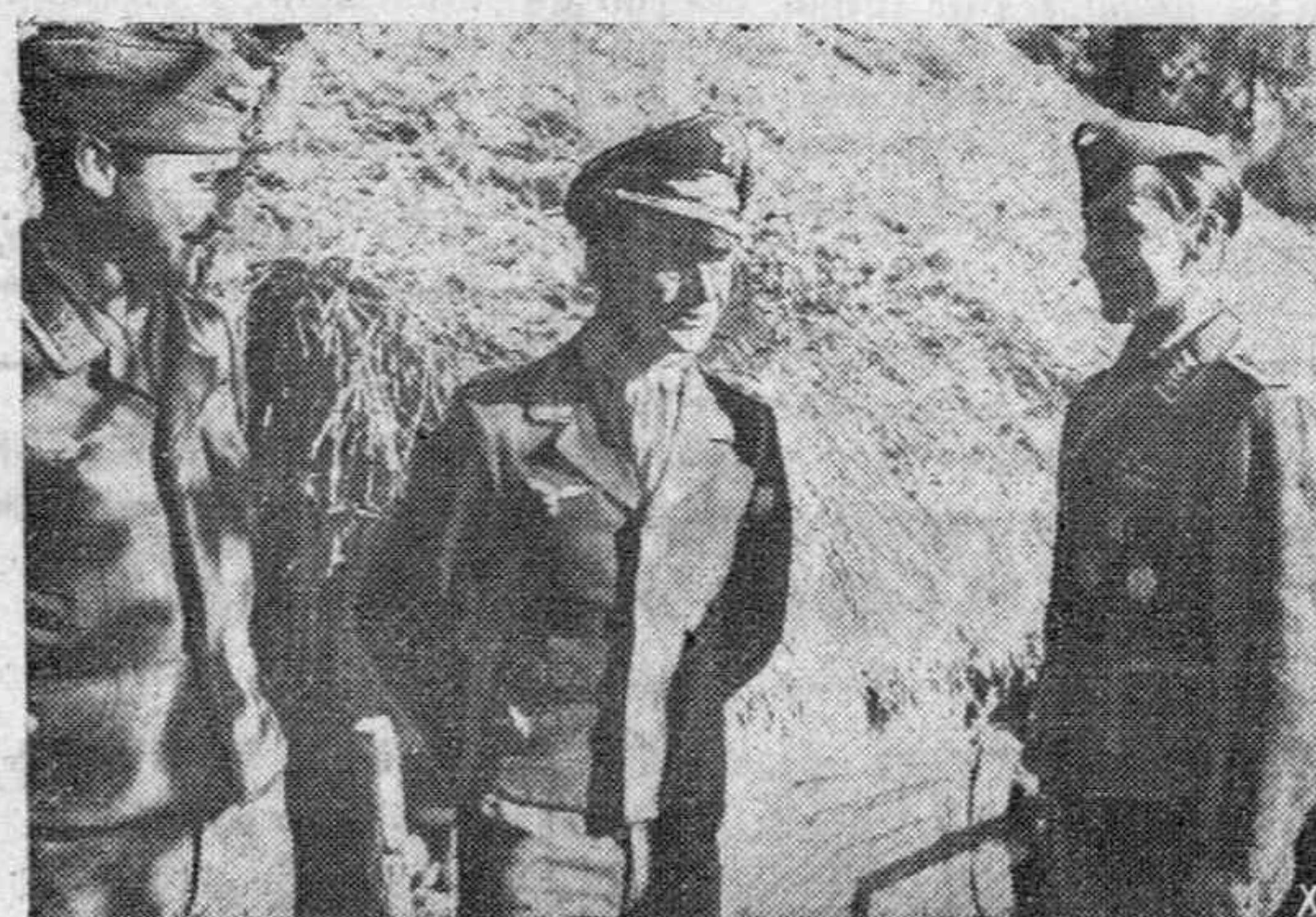
Los pilotos alemanes de exploración discuten el empeño de su próximo mil vuelo contra el enemigo con el capitán de su escuadrilla.