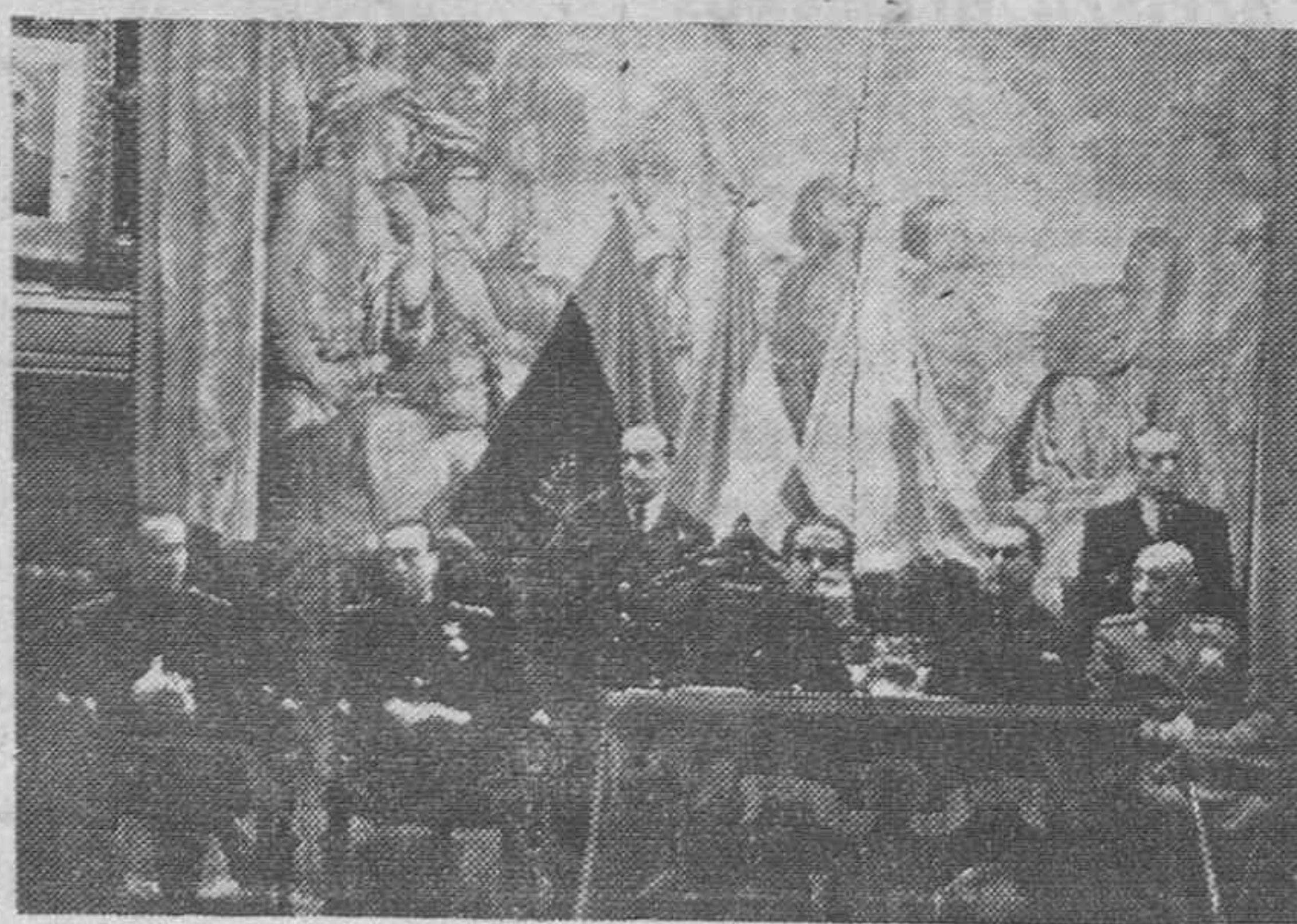
El Ministro de Trabajo, camada Girón, preside la inauguración de la Escuela Social en Madrid.