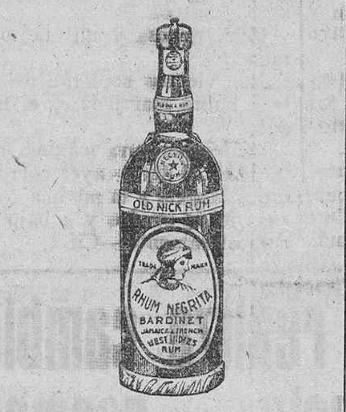
Tomando el legítimo.

Rhum negrita, de Bardinet, en infusión o leche bien caliente, adicionando una rodaja de limón y un poco de azúcar, evitará usted, atajándolos, los resfriados y otras molestias tan desagradables como frecuentes cuando el invierno llega.