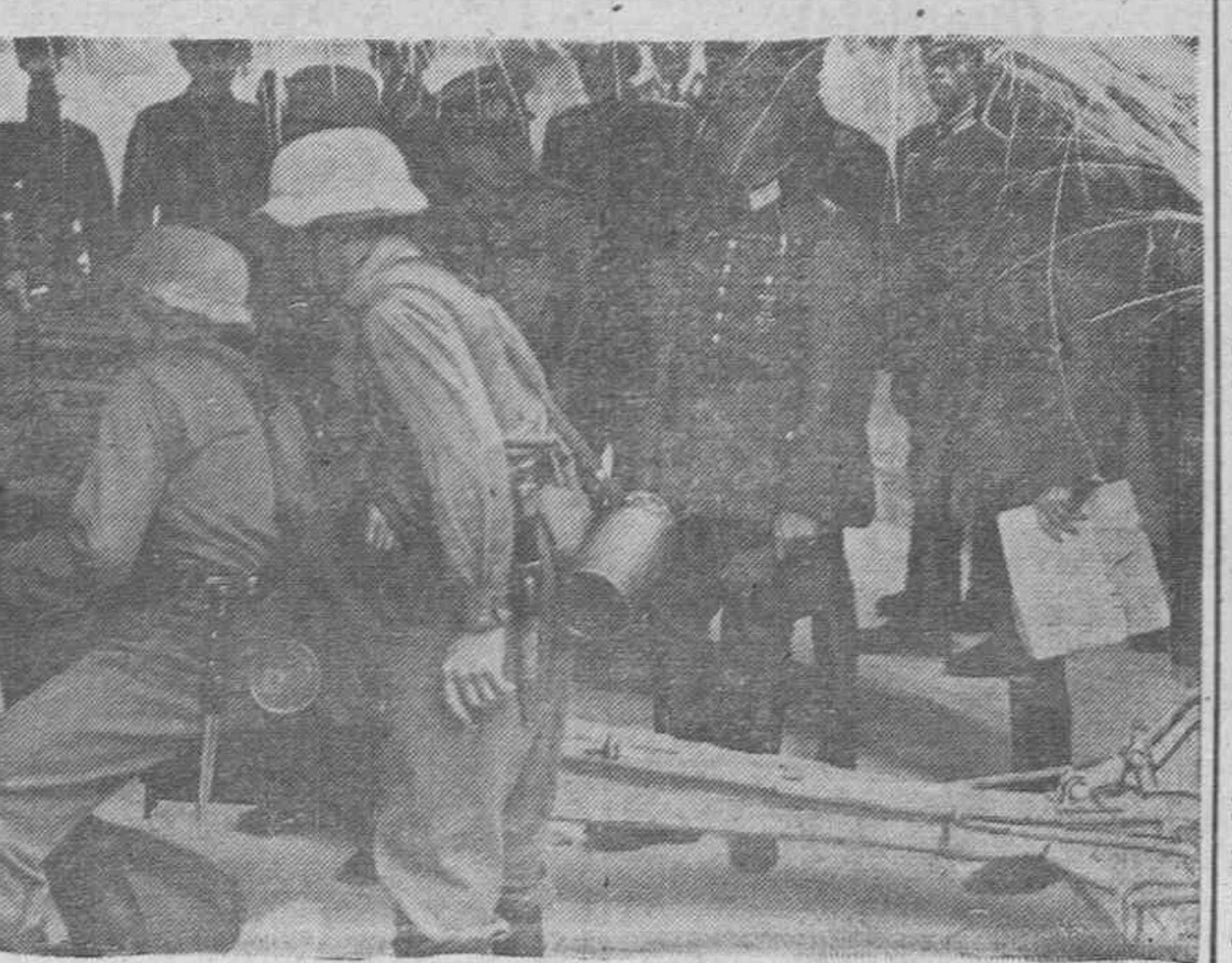
En una visita de inspección, girada recientemente por el Mariscal del Reich von Rundstedt a las fortificaciones de la costa atlántica, éste se interesó especialmente por las defensas artilleras.