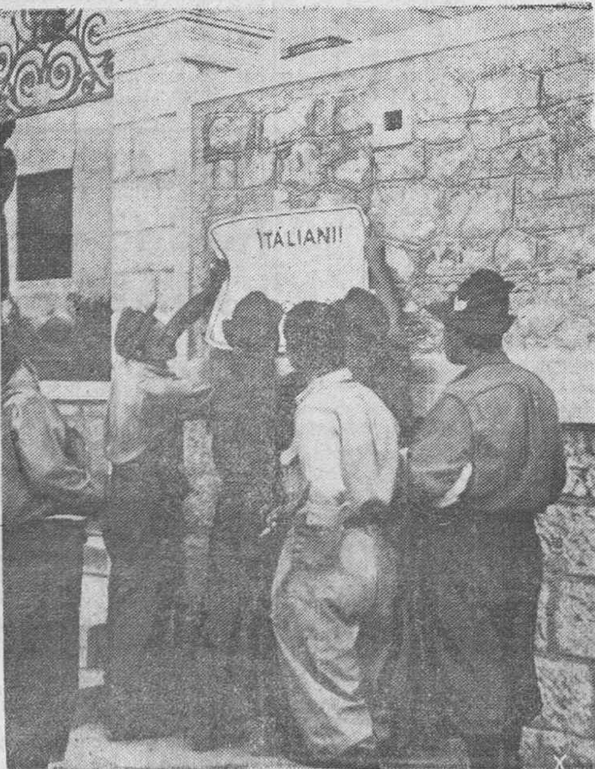
Estos soldados italianos colocan en una calle de una ciudad italiana carteles haciendo un llamamiento a todos los hombres para luchar al lado de las tropas alemanas.