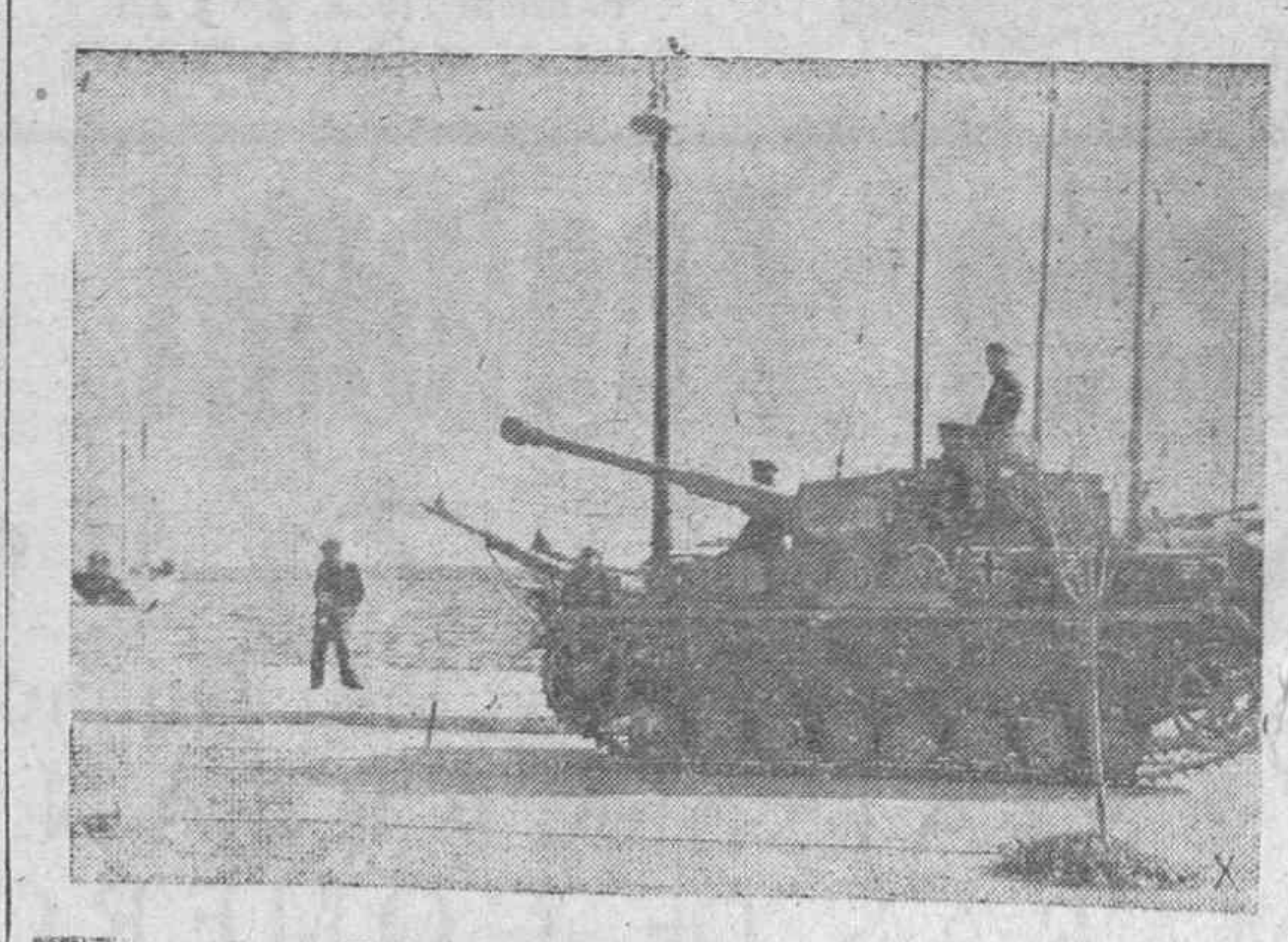
Tanques alemanes en Salónica.