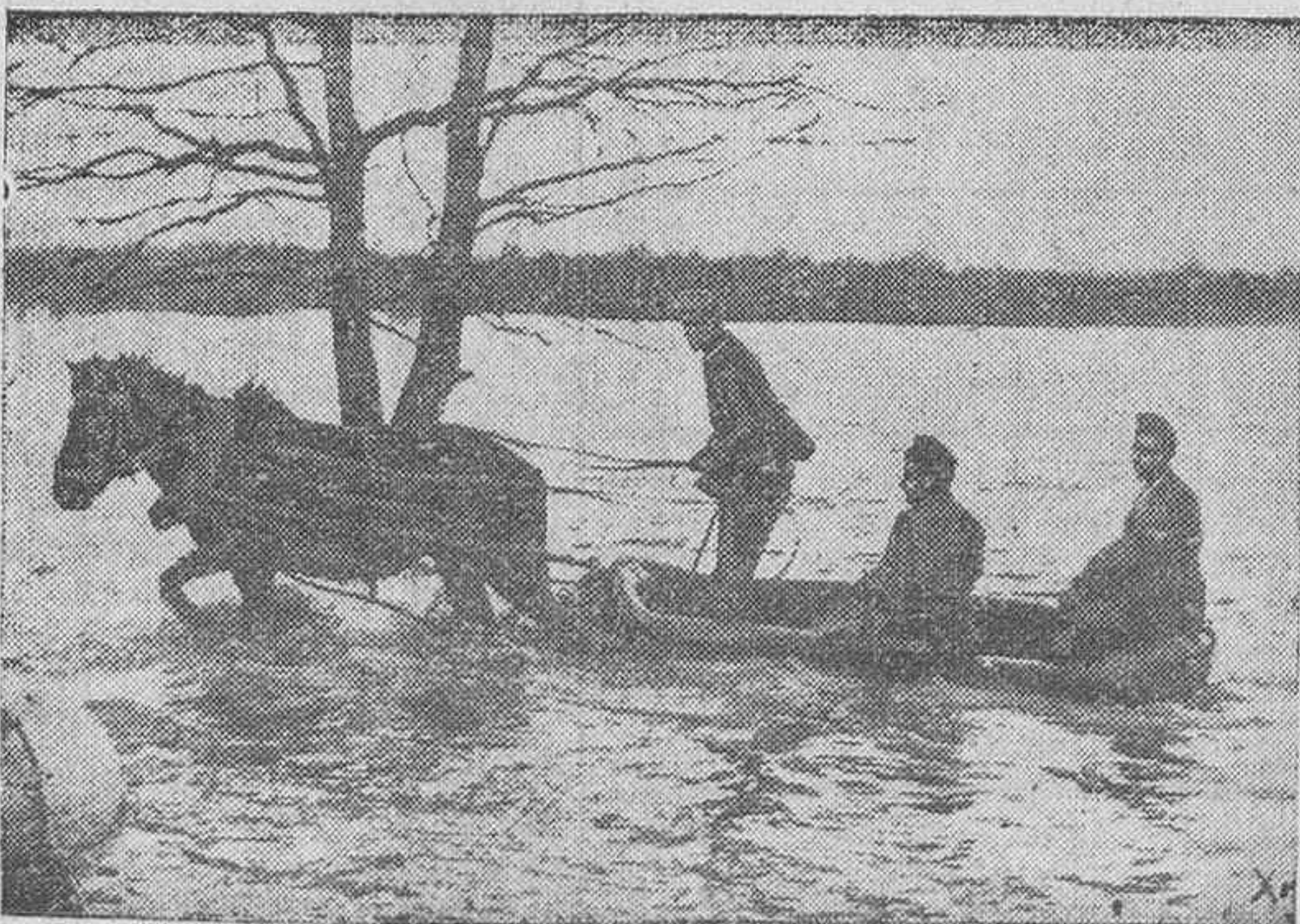
En algunos sectores inundados para poder marchar contra corriente las barquichuelas de los soldados alemanes han de ser tiradas por caballos.