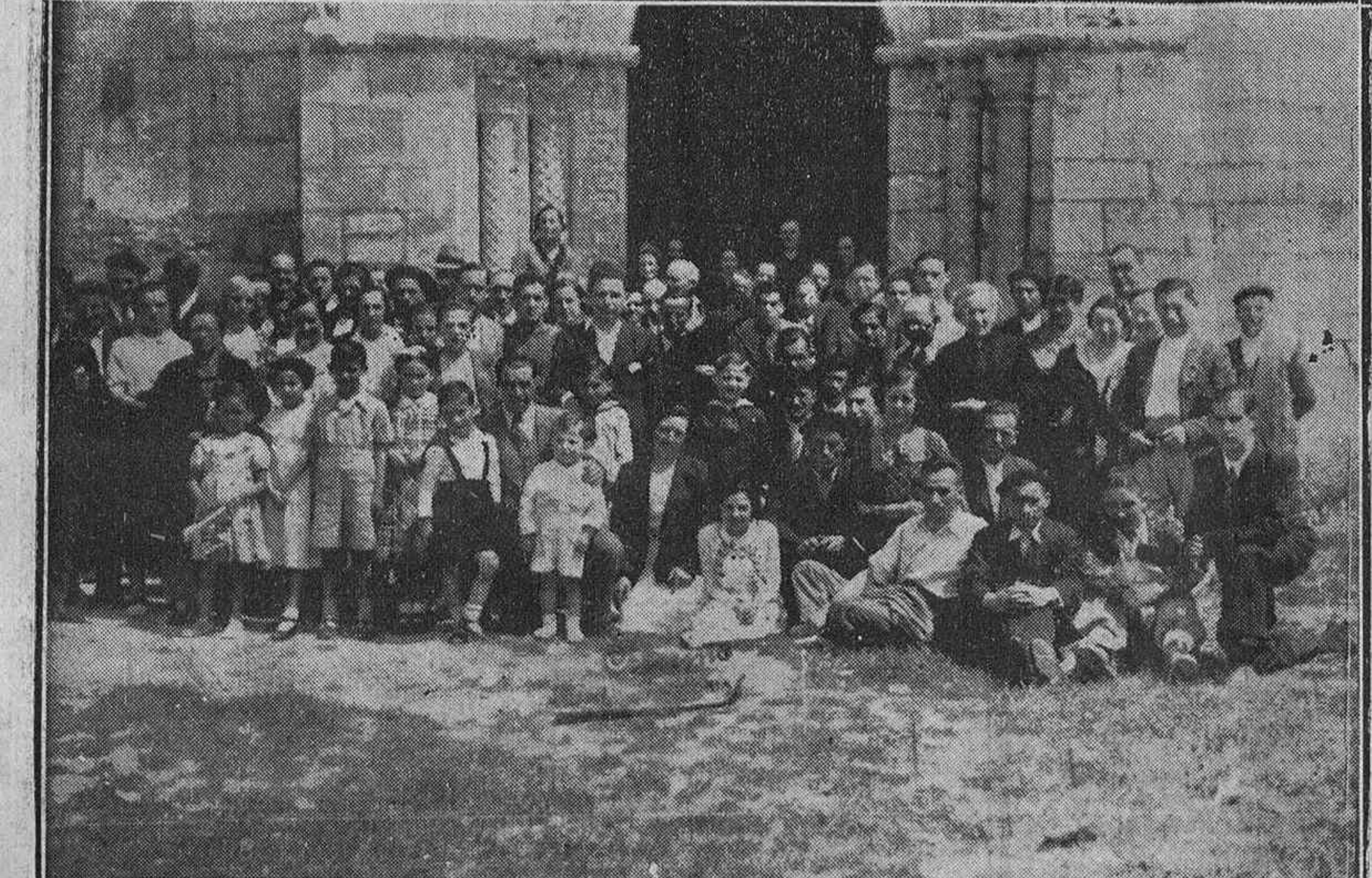
Un grupo de Hermandad Alavesa, que fueron ayer a Estíbaliz.

URQUIOLA OCULISTA Calle DATO, 8, 1.ª Dcha. Un peregrino.