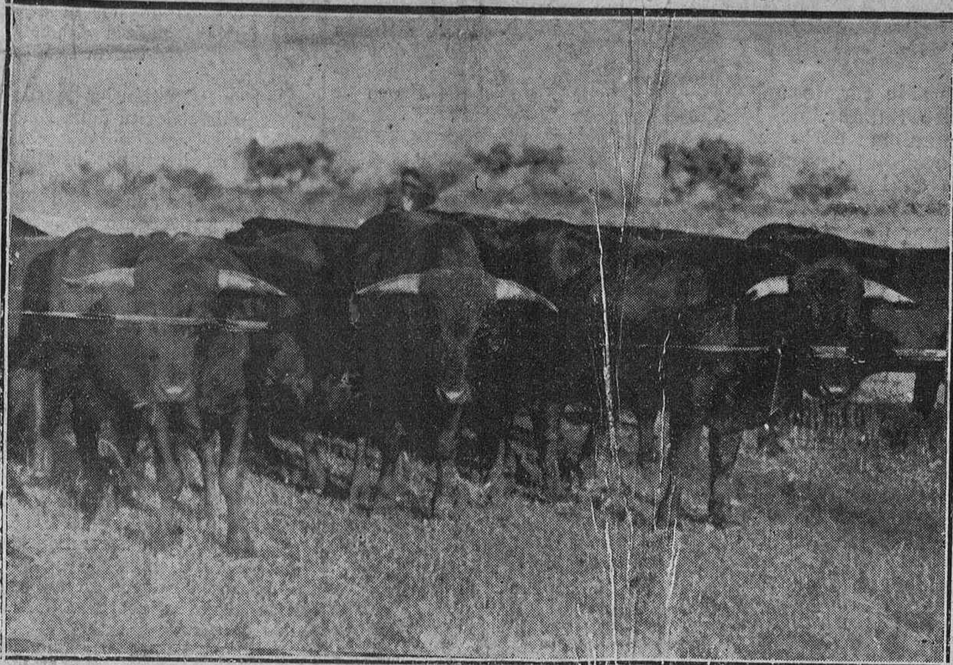
Ayer estuvieron en Logroño, en la acreditada ganadería de don Manuel Ebra, los distinguidos aficionados que han de estar como matadores en el festival tauromáquico que organiza la Asociación de la Prensa se celebrará el próximo domingo en la Plaza de Toros de Vitoria. Y quedaron seleccionados cuatro morlacos imponentes, preciosos de estampa, grandes como monumentos y con unos pitones que infunden pánico al más pintado. Ahí están, en una instantánea lograda por Ceterino. Admirémoslos el lector y apresúrese a sacar sus localidades. Que esto va a prisa. Y van a quedar pocas.