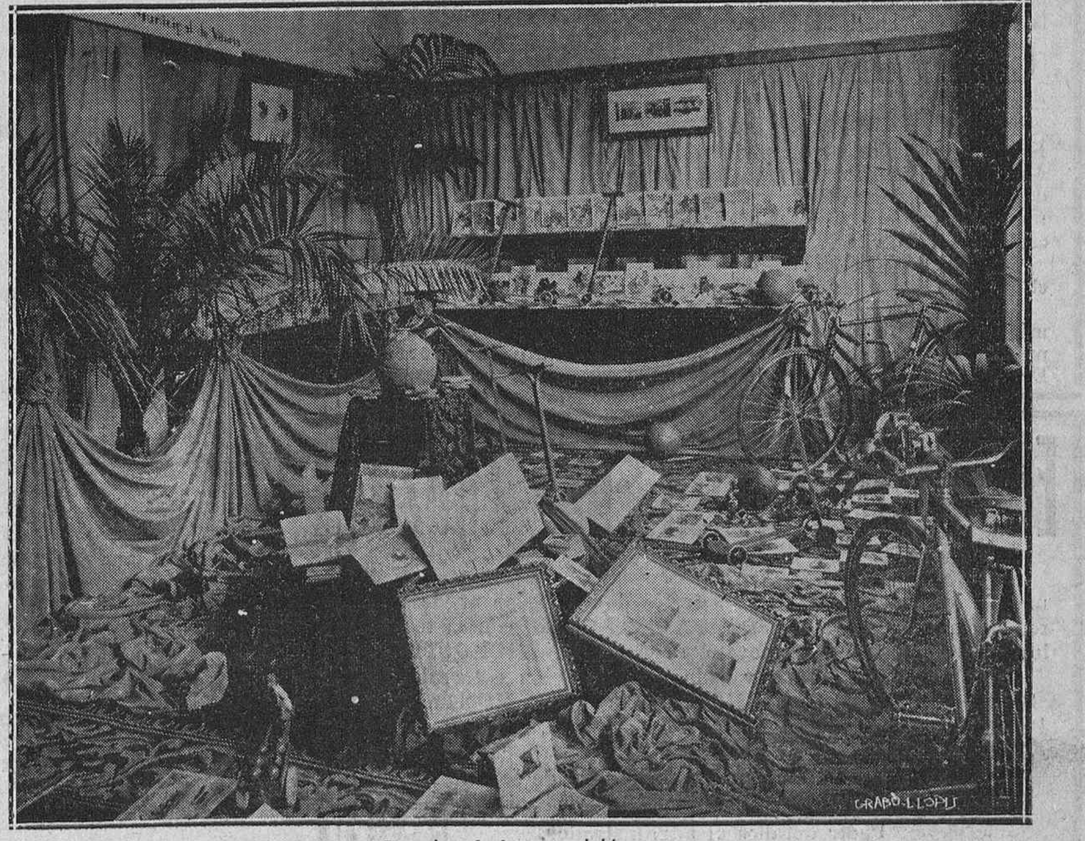
Interior de la exposición

La publicidad te favorece y nos ayuda. ANUNCIA.