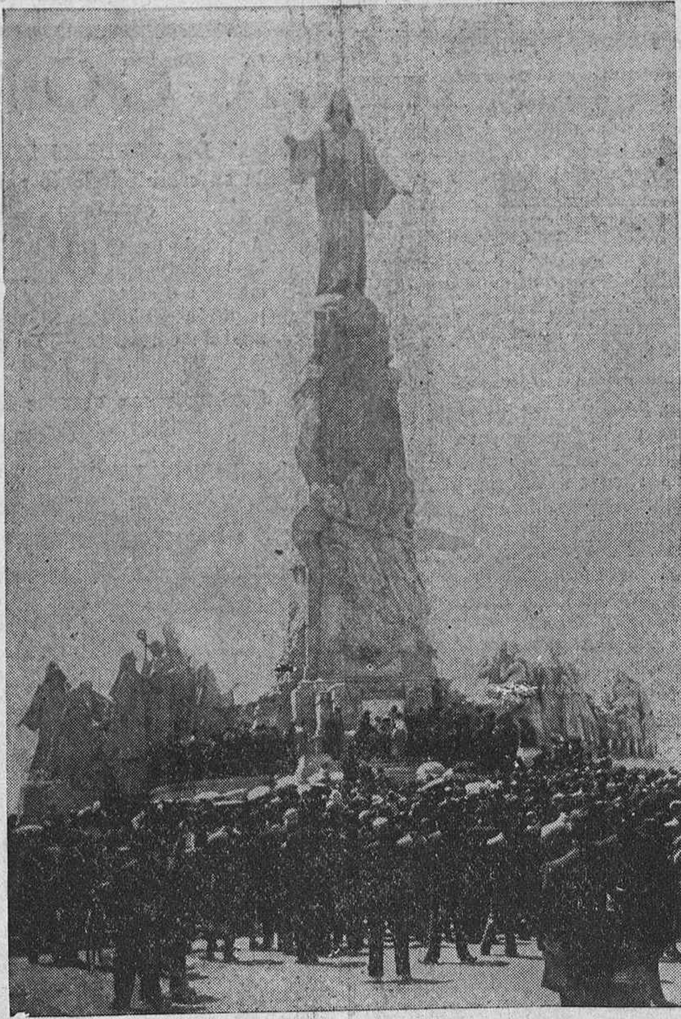
Durante el mes de junio, han vuelto a repetirse, en el Cerro de los Angeles, ante el monumento nacional al Corazón de Jesús...

Por todo ello no tengo inconveniente en afirmar que es un fuero laudable por su espíritu alta-