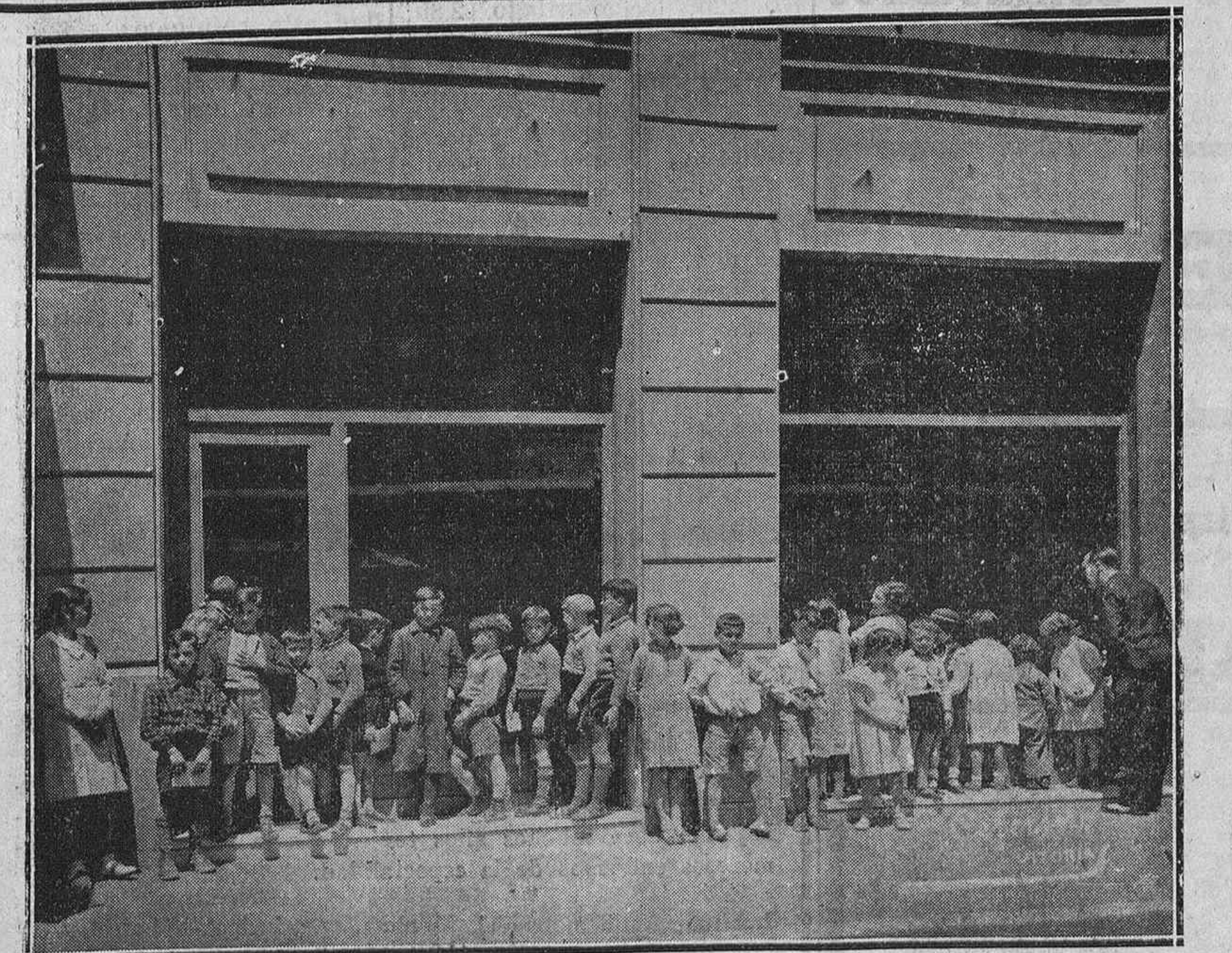
Tienda donde se halla instalada la exposición de premios que dedica la Caja de Ahorros Municipal de Vitoria a los niños de las Escuelas y Colegios que posean libretas escolares