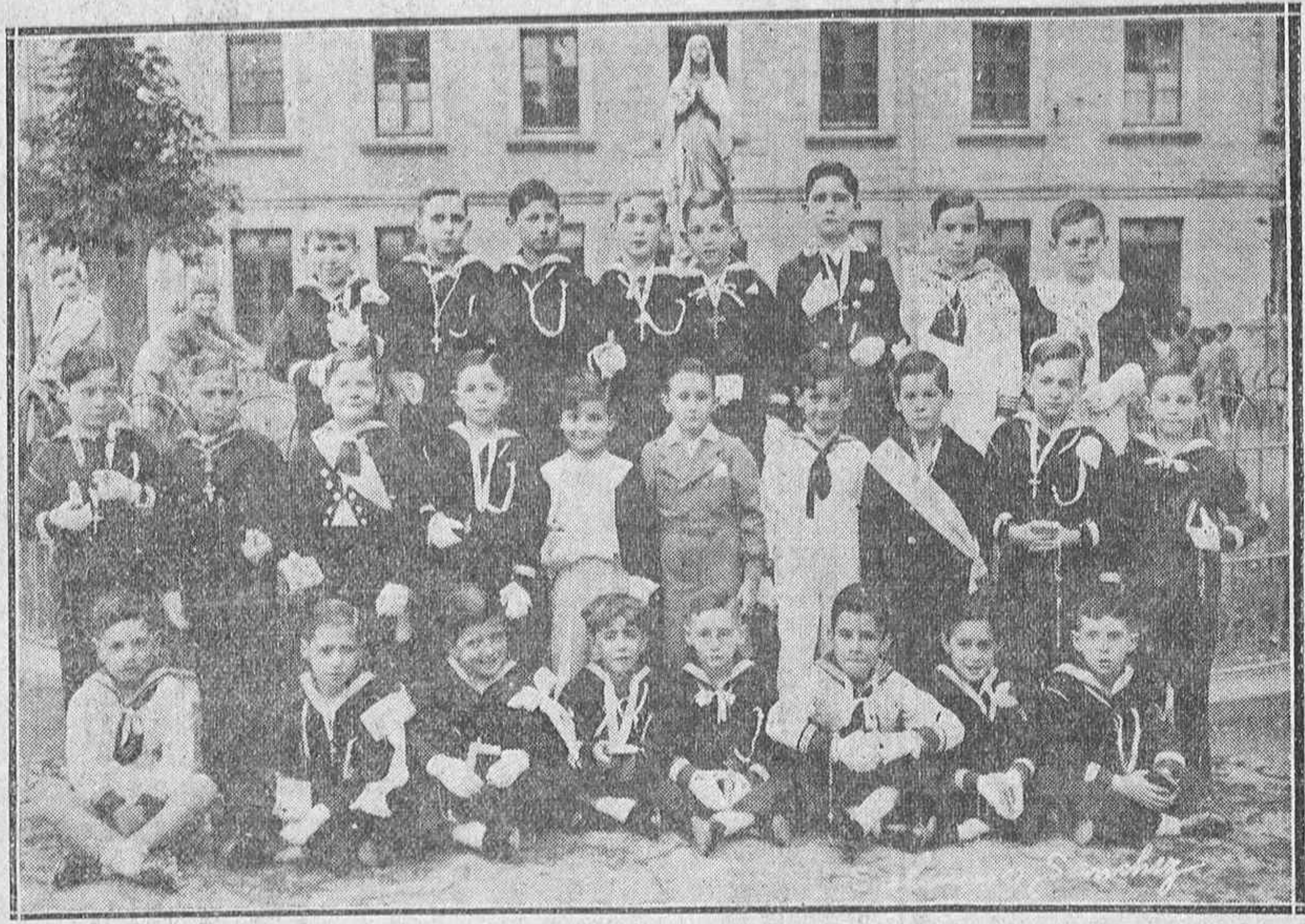
Se cuentan ya por docenas las tandas de nuevos comulgantes, este año, en nuestra ciudad, de todos sus barrios y parroquias. La presente es una nueva promoción preparada ayer por el Colegio "Minerva".