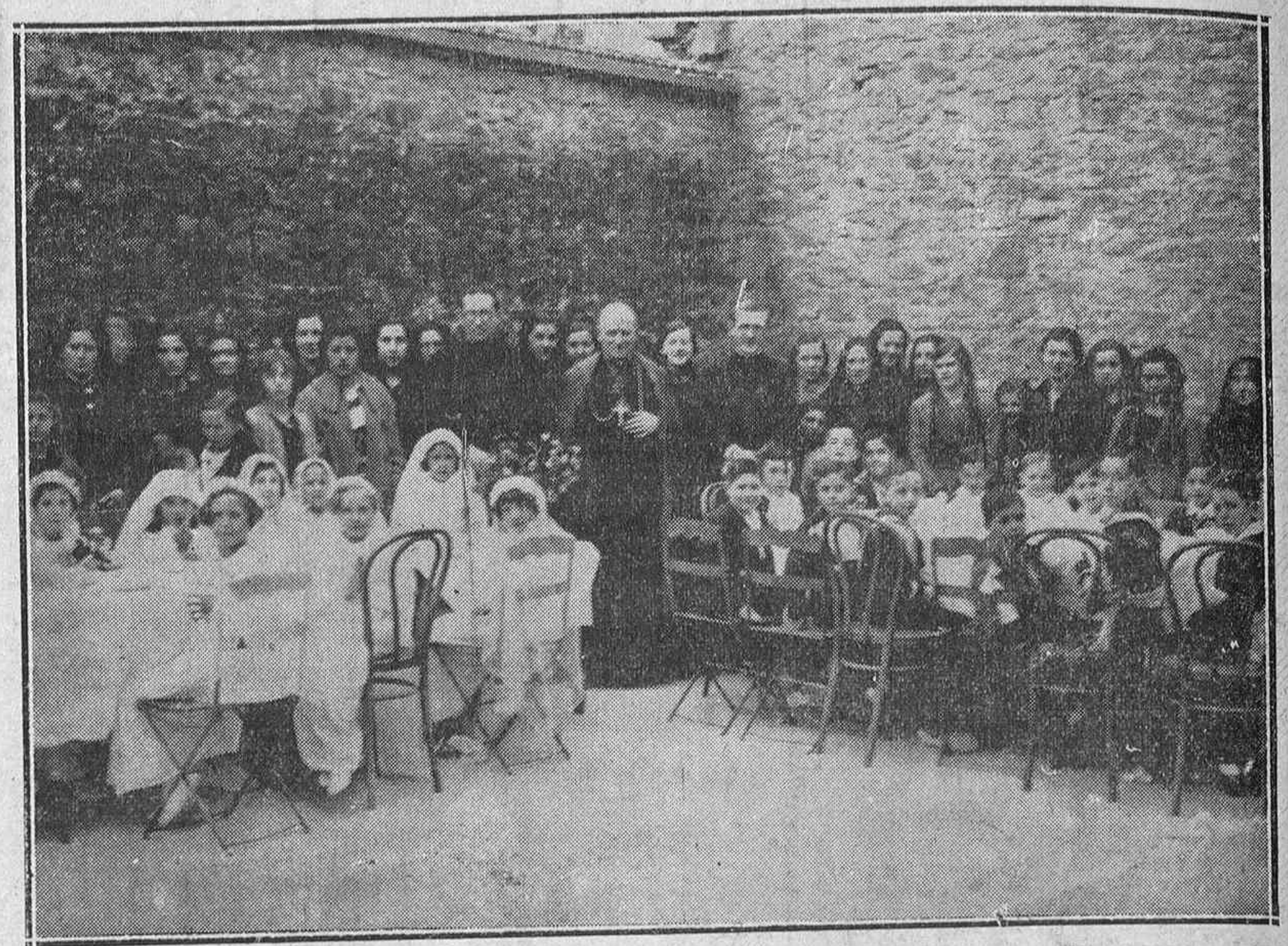
El primer fruto de la quinta Parroquia ayer inaugurada en Vitoria fué la Primera Comunión de 25 "peques", administrada por el Rvdmo. Prelado, quien, seguidamente presidió también el copioso desayuno de los noveles comulgantes.

Ayer, fiesta de la Ascensión del Señor, fué la inauguración solemne de la quinta parroquia vitoriana, la que se alza, airosa y acogedora en el antiguo poblado de Adurza, nuestro barrio actual de San Cristóbal; la que sustituye a la quinta parroquia vitoriana de San Ildefonso desaparecida cuando las últimas guerras civiles. Nota dominante de los actos de ayer en San Cristóbal fué la concurrencia y piedad extraordinarias. Otro detalle máximo, el "parroquialismo" de la nueva feligresía que sigue, estos días, aportando nuevos donativos y obsequiosa su templo parroquial. Otro acto, en fin, nada despreciable de la ceremonia inaugural, la participación de los fieles, singularmente de los niños, en las funciones litúrgicas.