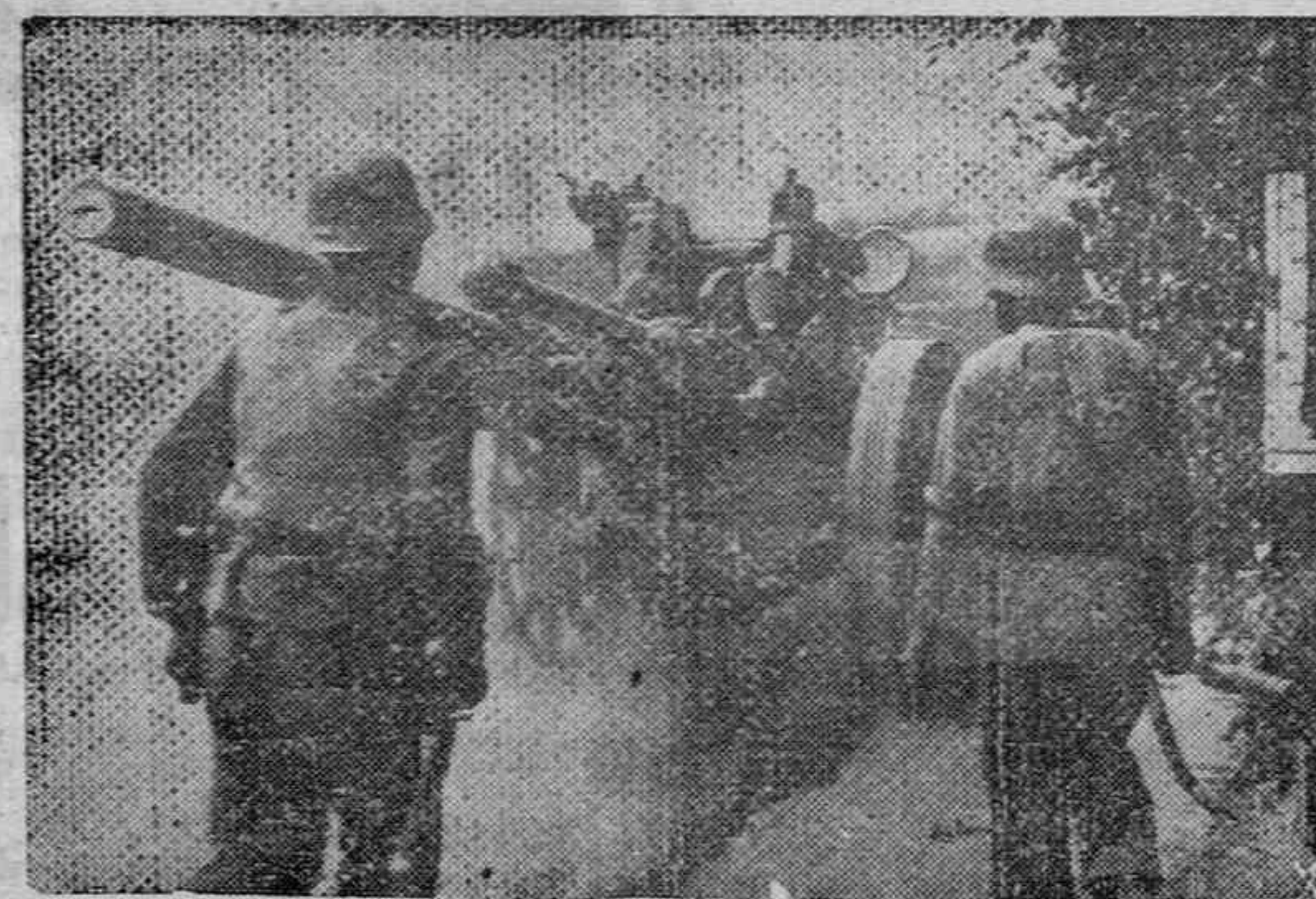
Artillería e infantería alemanas en las primeras líneas del sector central.