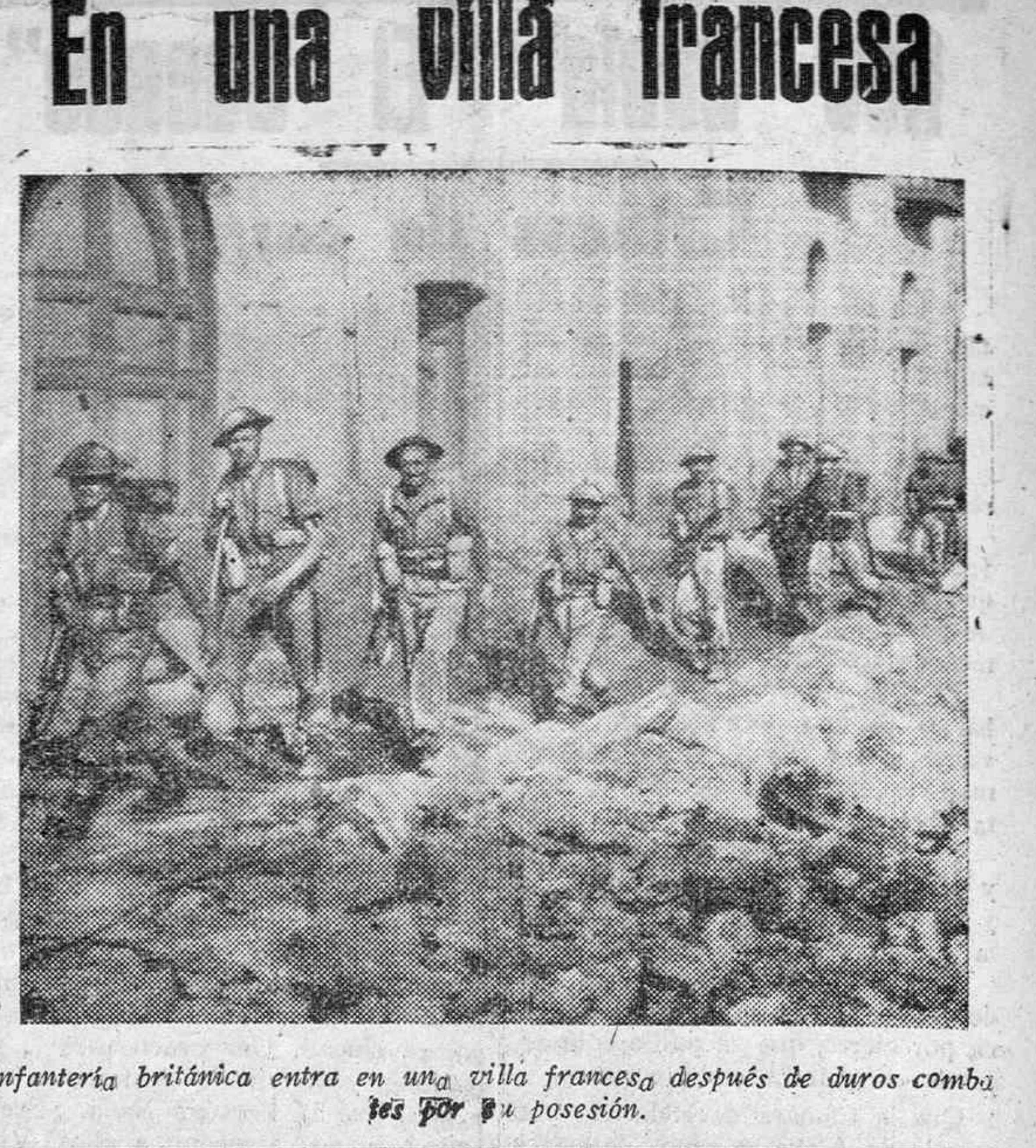
Infantería británica entra en una villa francesa después de duros combates por su posesión.

Lotería Nacional El sorteo de hoy Madrid.—En el sorteo de la Lotería Nacional, celebrado hoy en Madrid, han correspondido premiados los siguientes números y poblaciones: Premiado con 100.000 pesetas: 19.203.—Valencia, Mieres, Alicante, Jerez de la Frontera, Murcia, Córdoba y Madrid. Premiado con 60.000 pesetas: 3.191.—Granada, Vigo, Avila, Granada, Córdoba, Valencia y Madrid. Premiado con 20.000 pesetas: 17.407.—Santander, San Sebastián, Ceuta, Jerez de la Frontera, Melilla, Palma de Mallorca, Madrid y Valencia. Premiados con 1.500 pesetas: 2.455 20.677 13.205 9.220 42.375 24.257 14.132 42.269 28.098 y 40.181.—(Cifra).