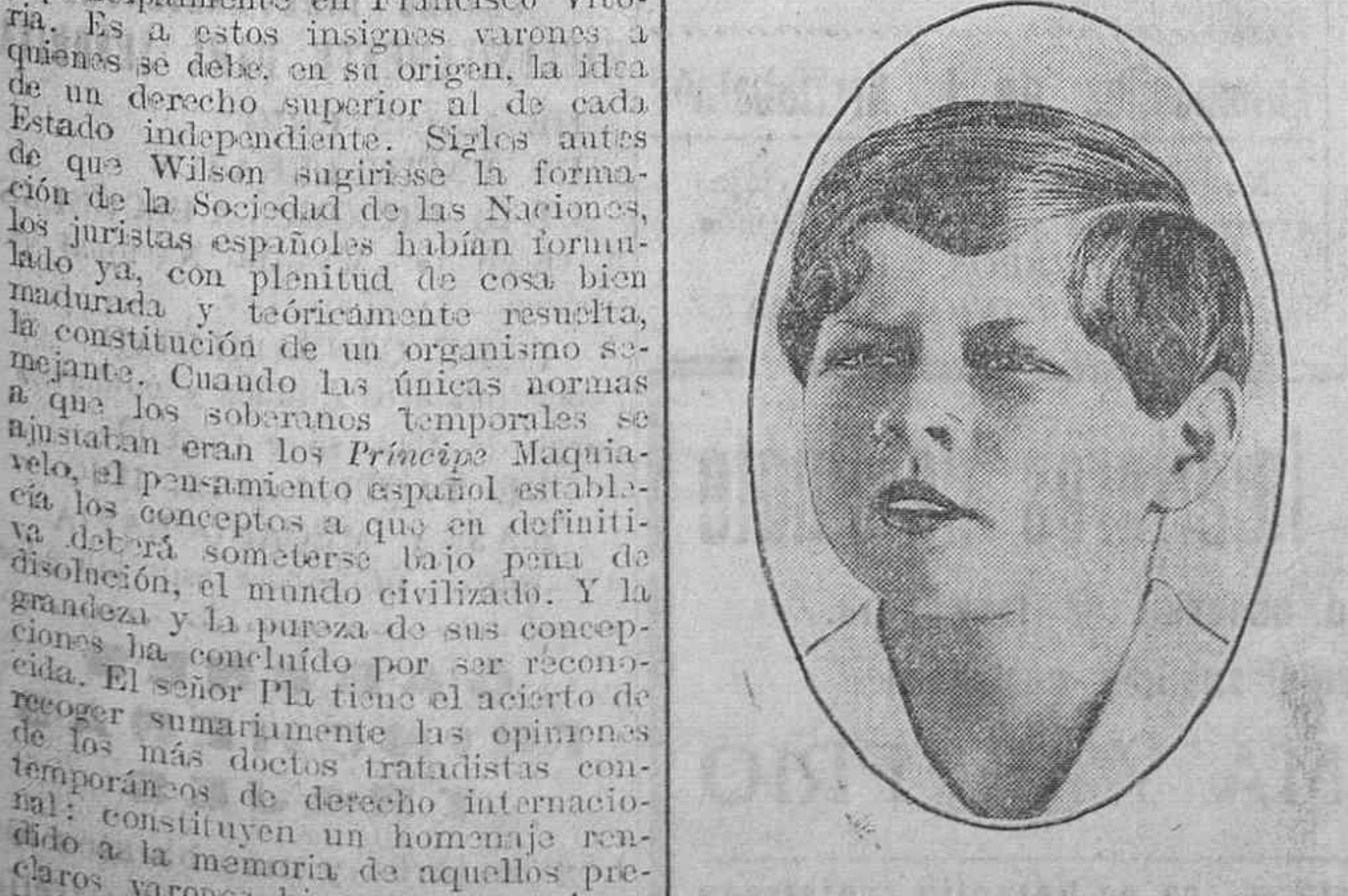
Una foto del rey de Rumania el día en que cumplió los 7 años, hace diez días.

SE VENDEN una sillería y una estufa. Razón: Florida, 28, 3.ª planta.