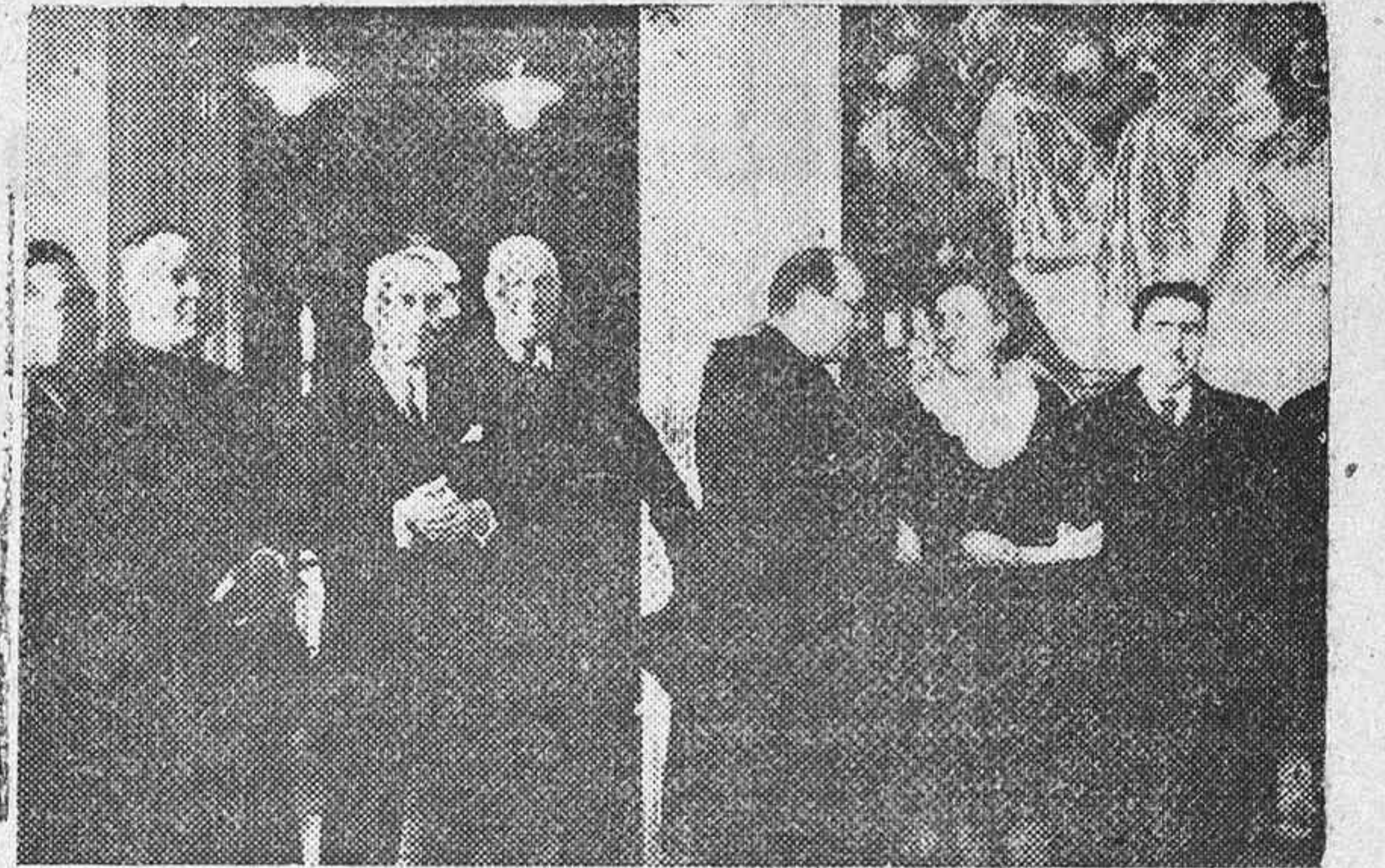
Los Ministros de Educación Nacional y de la Gobernación y otras Autoridades y Jerarquías presiden la conferencia del profesor Jiménez Díaz dada en el salón de actos del Consejo de Investigaciones Científicas.