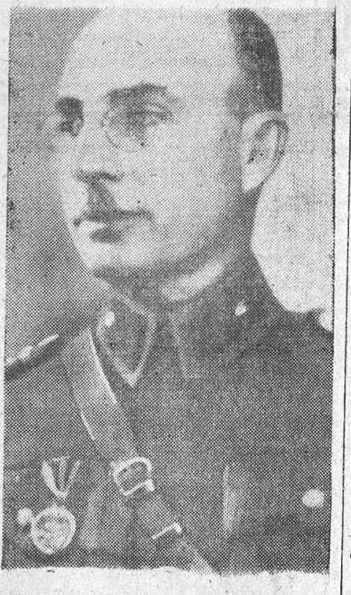
El General Gazim Orbay que ha sido nombrado recientemente General de Estado Mayor.