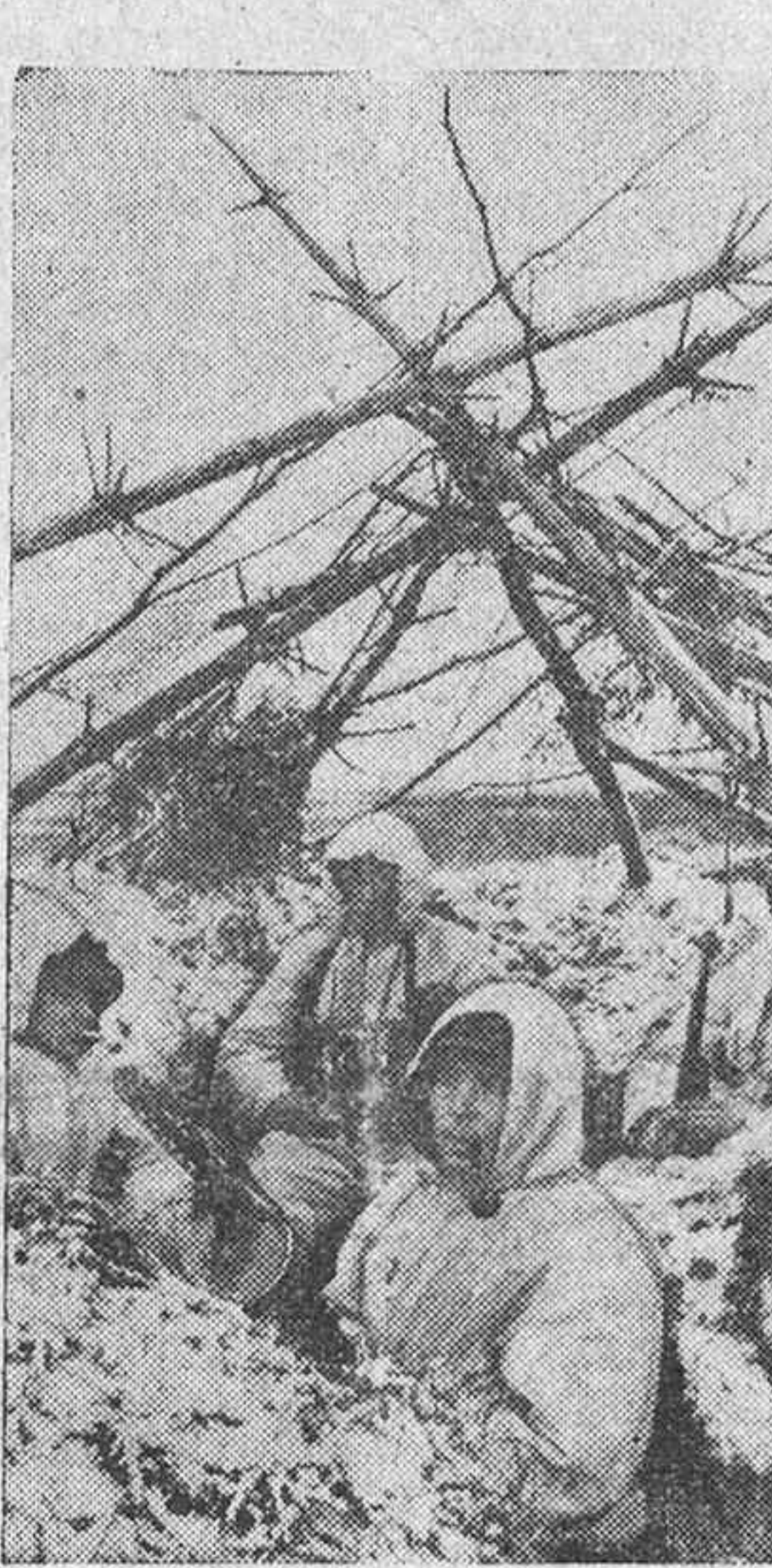
Puesto avanzado de una unidad de antitanquistas alemanas.