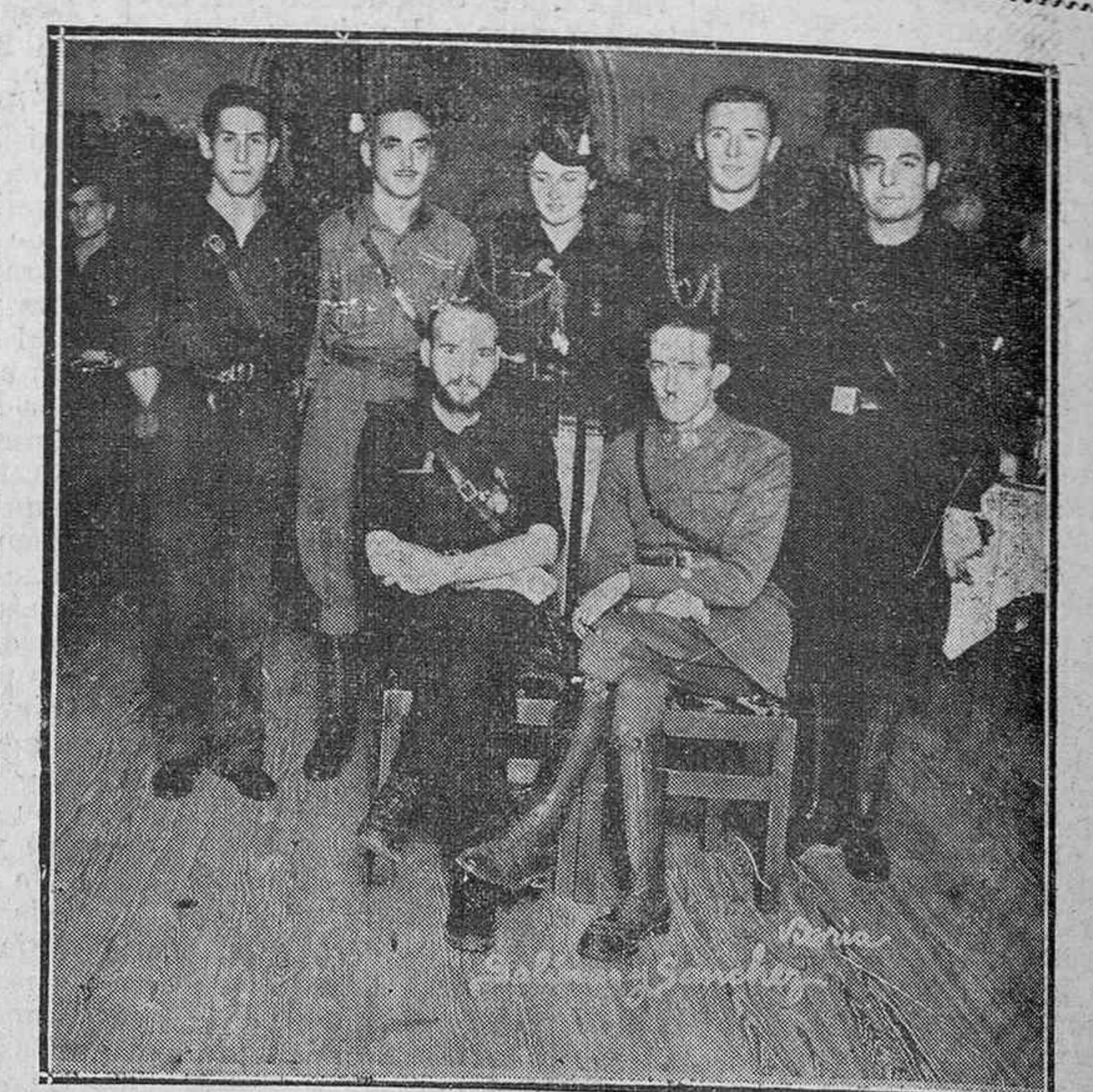
Algunos de los heroicos defensores del Alcázar de Toledo, con los jefes de Falange de Vitoria. (Foto Salinas y Sánchez).