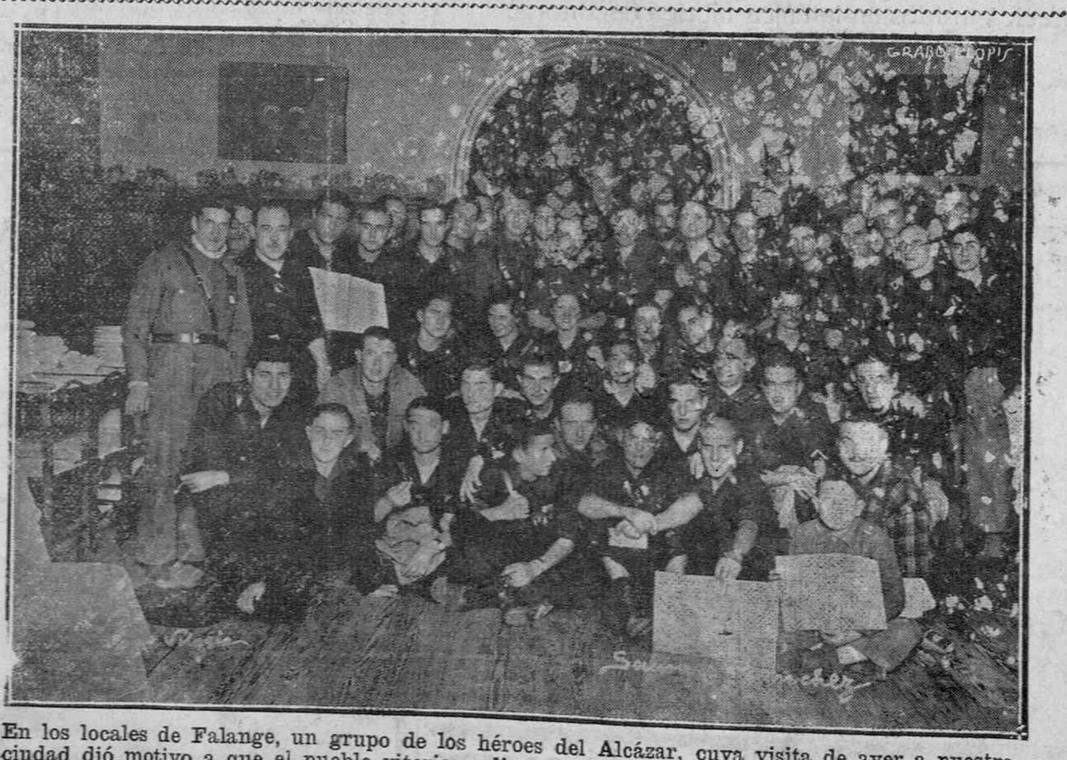
En los locales de Falange, un grupo de los héroes del Alcázar, cuya visita de ayer a nuestra ciudad dió motivo a que el pueblo vitoriano diese una vez más rienda suelta a su entusiasmo patriótico.