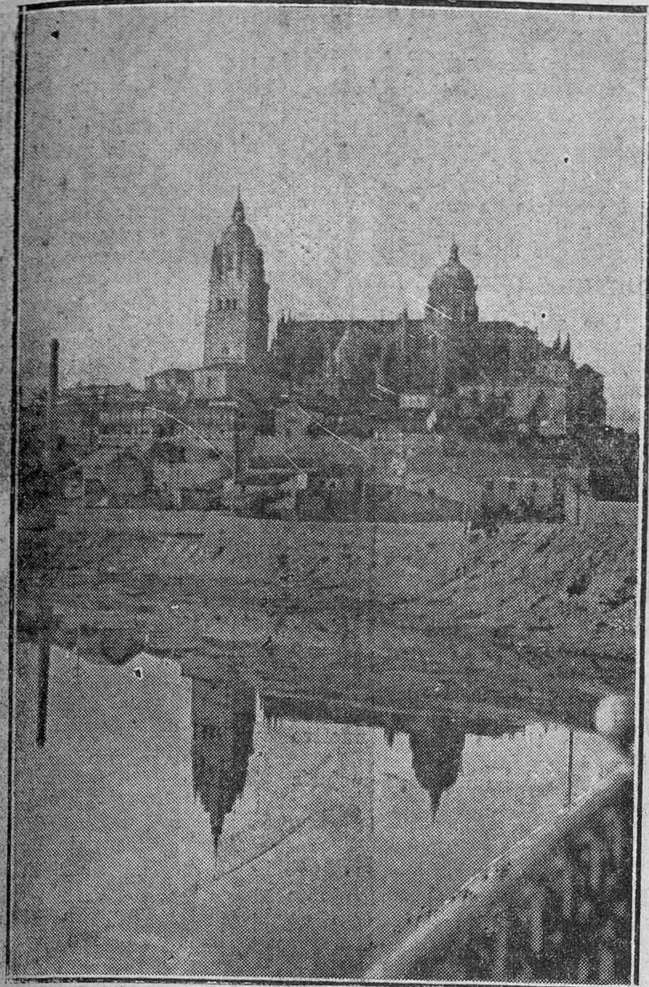
¡Salamanca! La ciudad prócer, cuna de hidalgos y forjadora de sabios, se retrata en su río formando un cuadro incomparable. Como esas aguas en las que se refleja con coquetería de mujer, así de limpia y de bella es su conducta para con España. Ejemplar, como siempre lo fué, digna, como siempre lo será

Nuestros soldados pasan frío y no deben pasarlo. Alaveses: Entregad inmediatamente mantas en Hermandad Alavesa