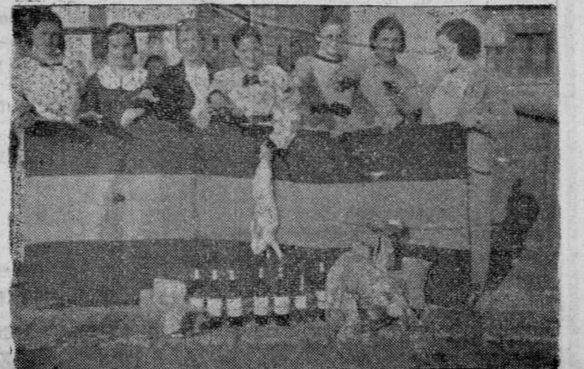
Araya.—Bellas señoritas, postulando para las Milicias patrióticas