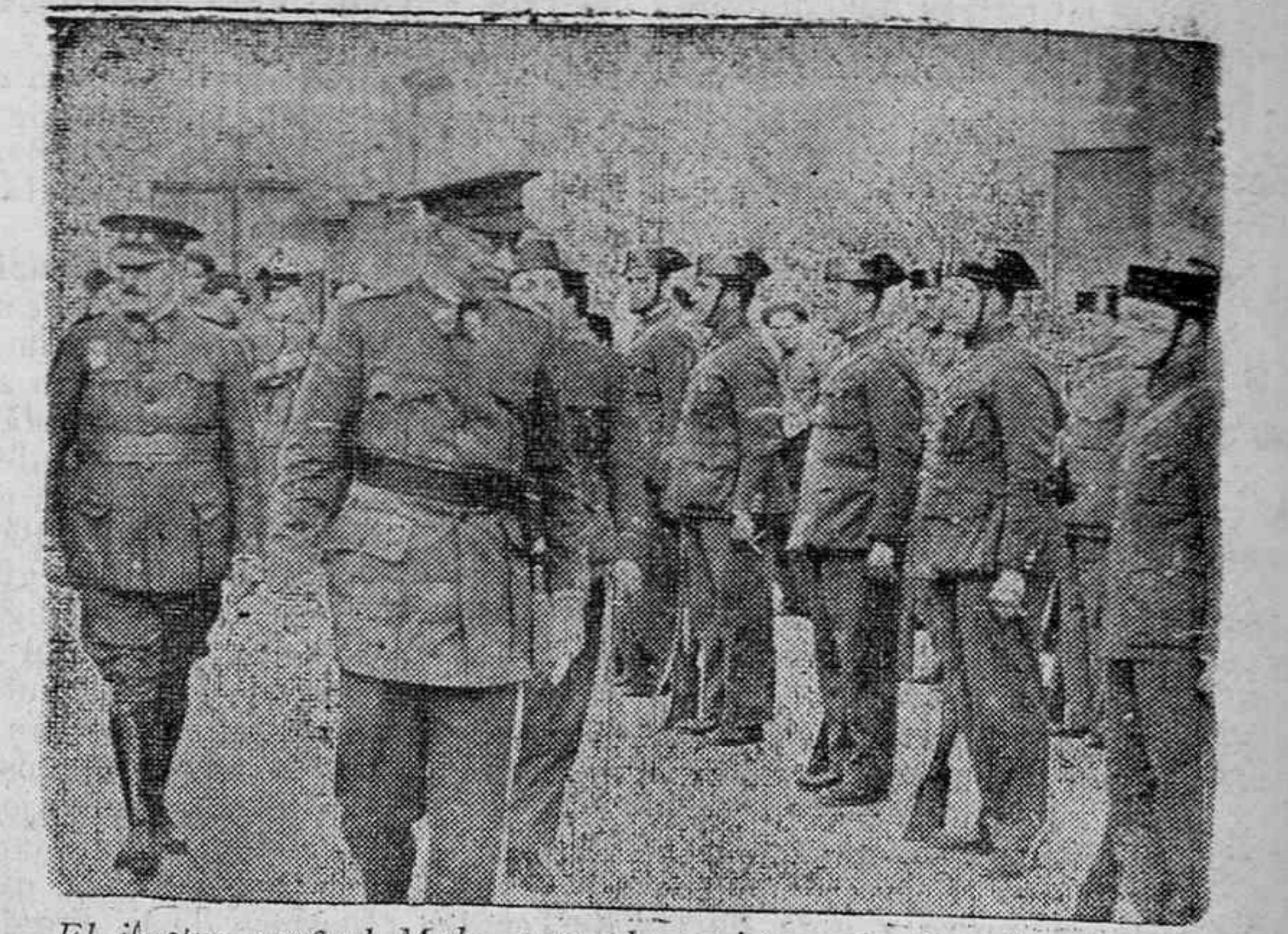
El ilustre general Mola, pasando revista a la Guardia civil, en Burgos

El Excmo. señor Obispo y demás autoridades fueron despedidos en el atrio del palacio por todos, tributándoseles una cariñosa despedida.