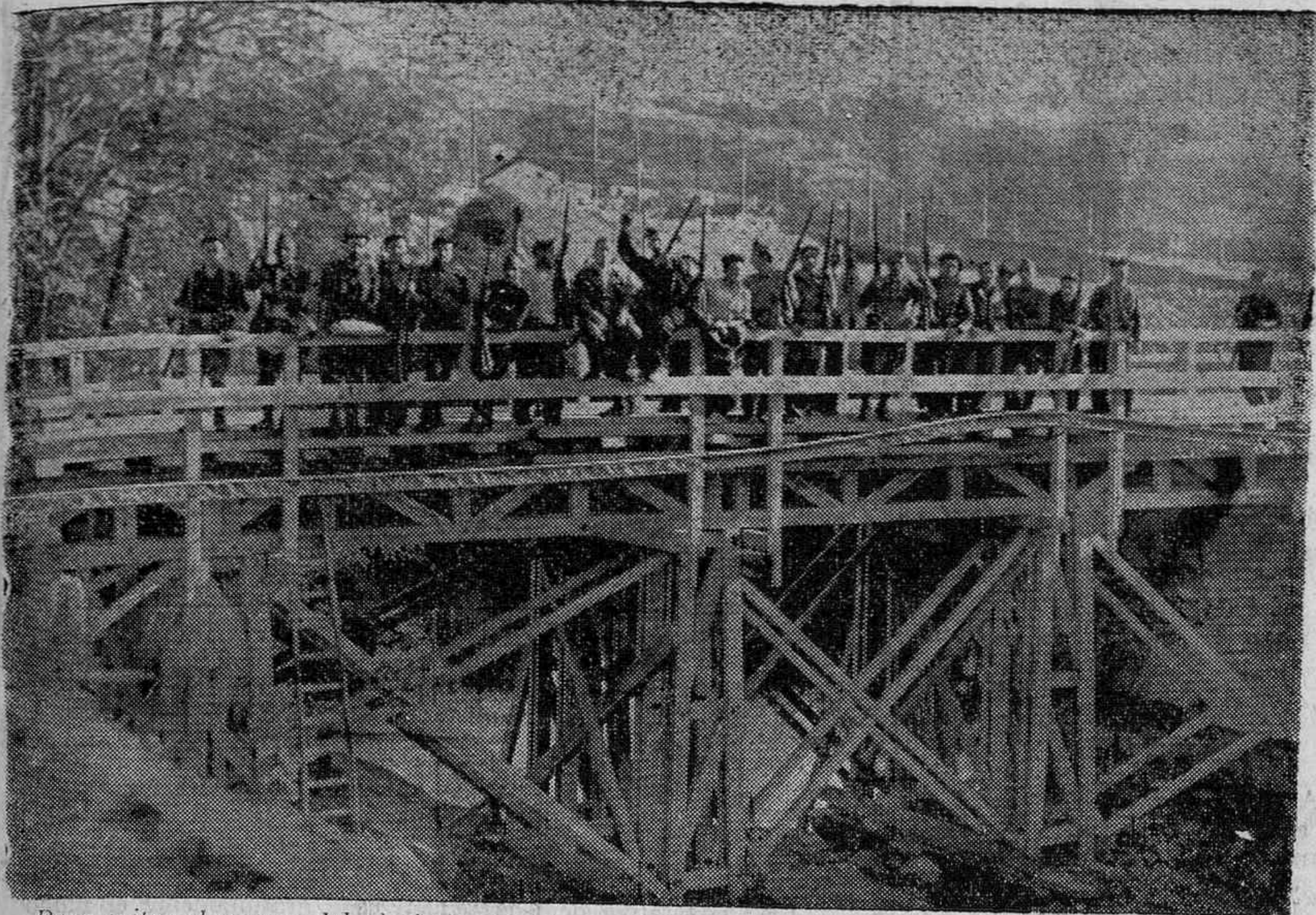
Para evitar el avance del glorioso ejército español hacia San Sebastián, las milicias rojas, en su retirada, volaron el puente de Andoain. Pero ayer estaba ya reconstruido por nuestras fuerzas, como puede apreciarse por esta fotografía que obtuvo nuestro gran repórter el popular y simpático Ceferino