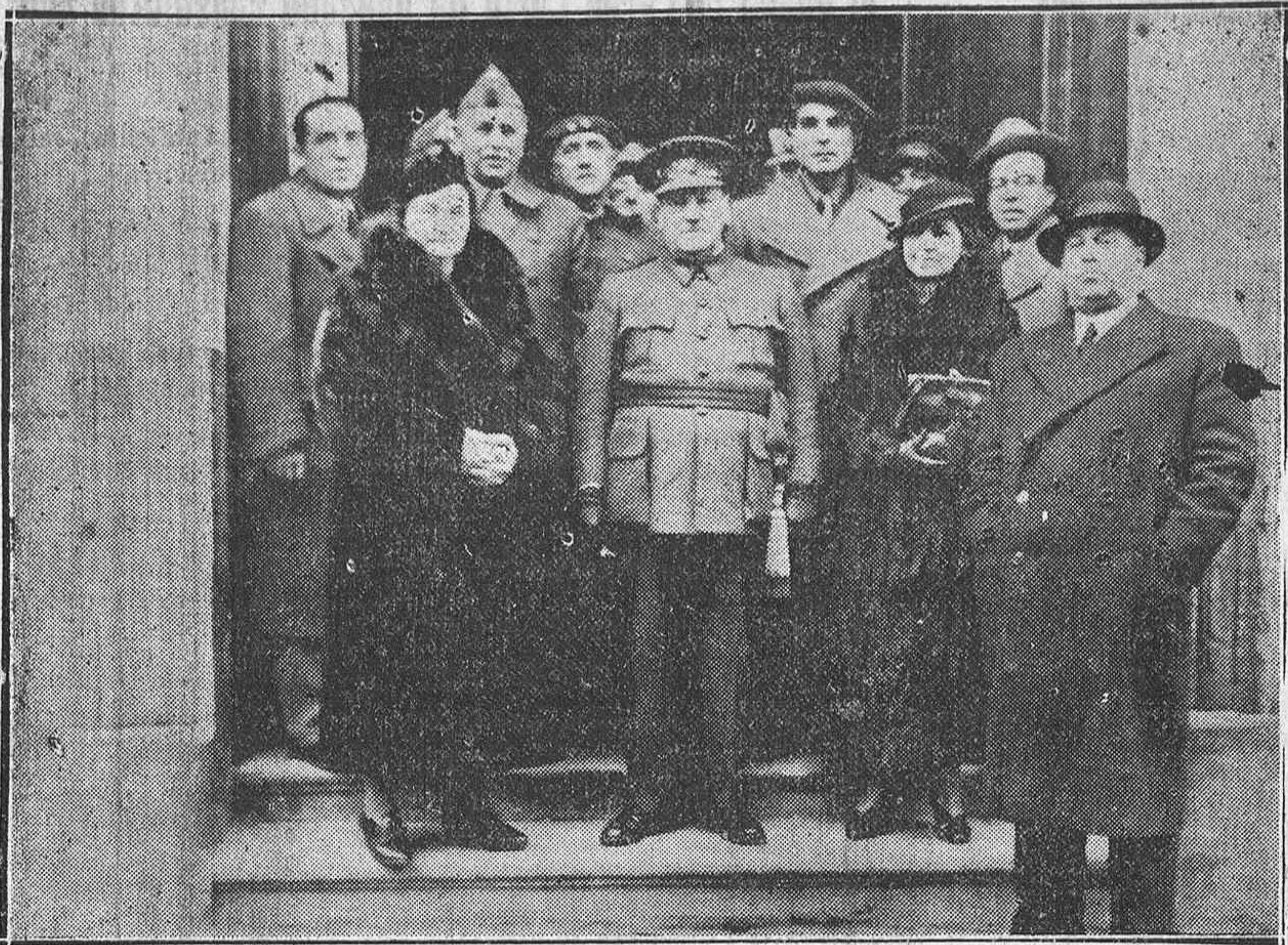
El General Martínez Anido, presidente nacional del Patronato Antituberculoso, acompañado de nuestras autoridades después de inaugurar ayer por la tarde la Enfermería antituberculosa en el Antiguo Seminario de Aguirre.

ANUNCIOS TELEGRÁFICOS TARIFA Hasta quince palabras ..... Ptas. 1'00 Cada palabra de aumento ..... 0'10 CONSULTE ANUNCIOS CON TARIFA REDUCIDA