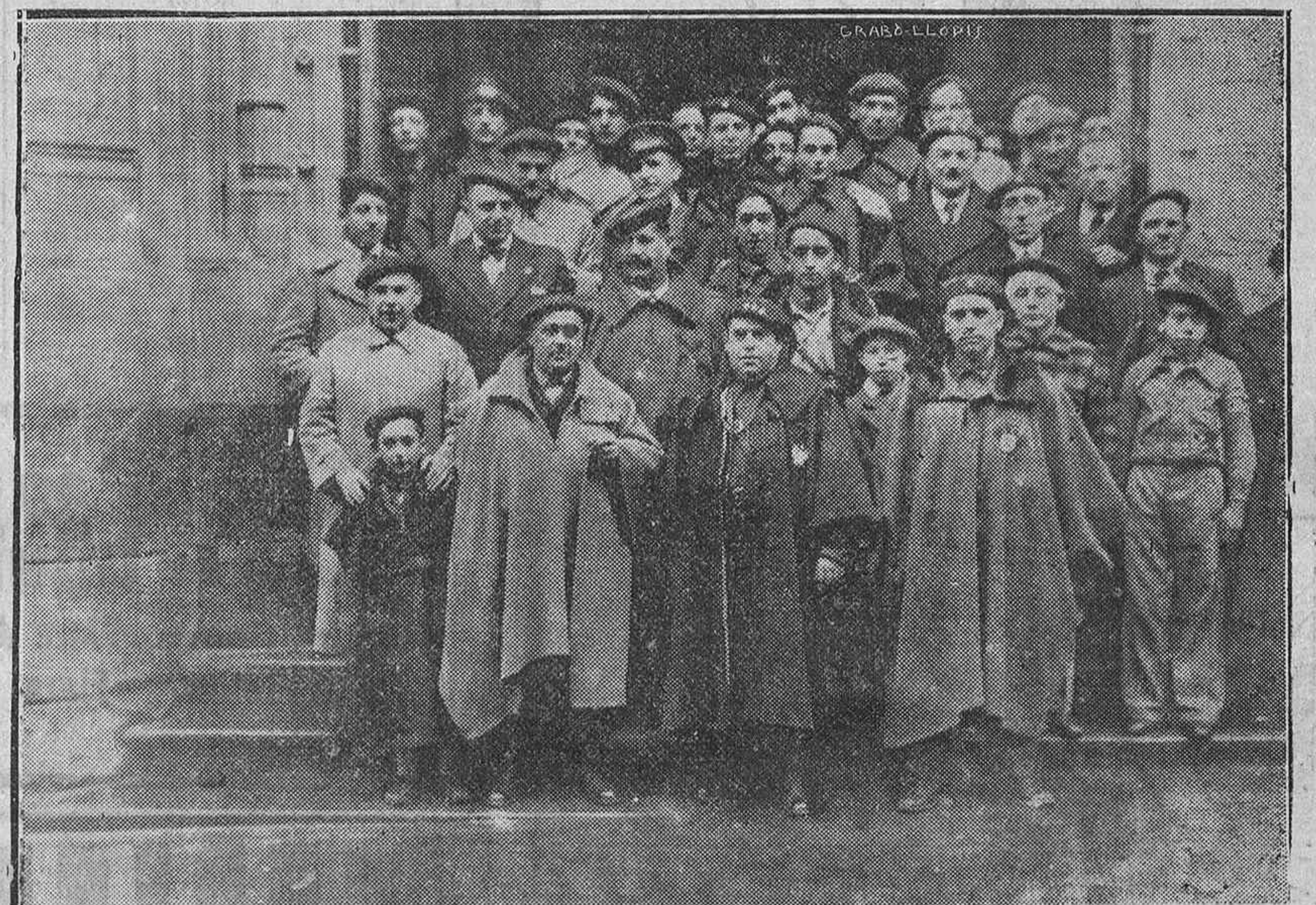
El glorioso Cuerpo del Requeté Auxiliar de Alava celebró ayer una solemne función en la iglesia de San Pedro con motivo de la festividad de su Patrona la Inmaculada, asistiendo el excelentísimo señor Gobernador civil y el Jefe Provincial de Falange Española Tradicionalista.

Mañana día 10, para conmemorar la festividad de Nuestra Señora de Loreto, Patrona de la Aviación, se celebrará una Misa a las once en la Iglesia de las MM. Reparadoras. Asimismo el alumbrado del Santísimo de todo el día será con la misma intención.