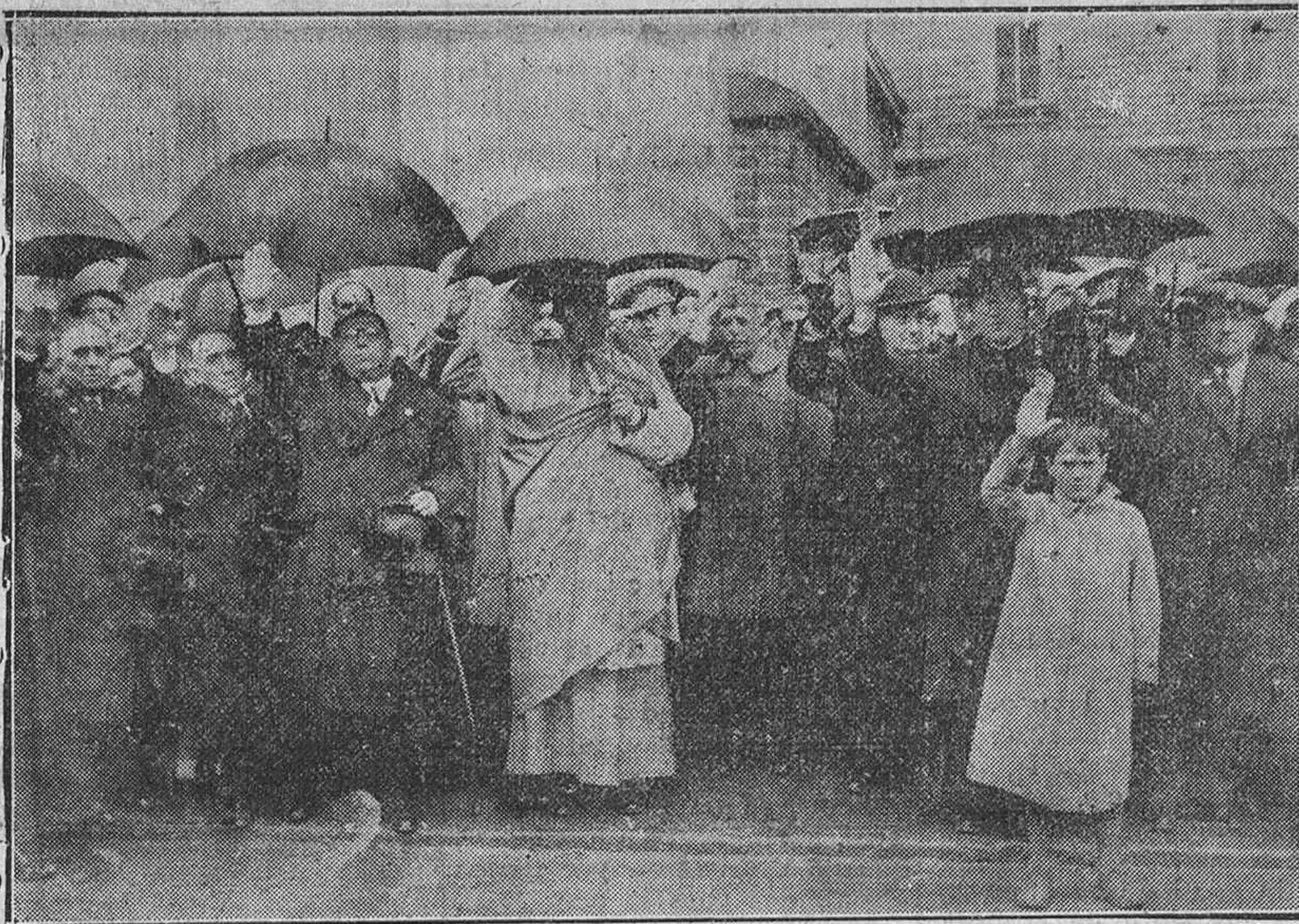
Nuestras autoridades, a la salida del Carmen, presencian el desfile de las tropas de Infantería. El temporal de lluvia no impidió la grandeza del acto patriótico.