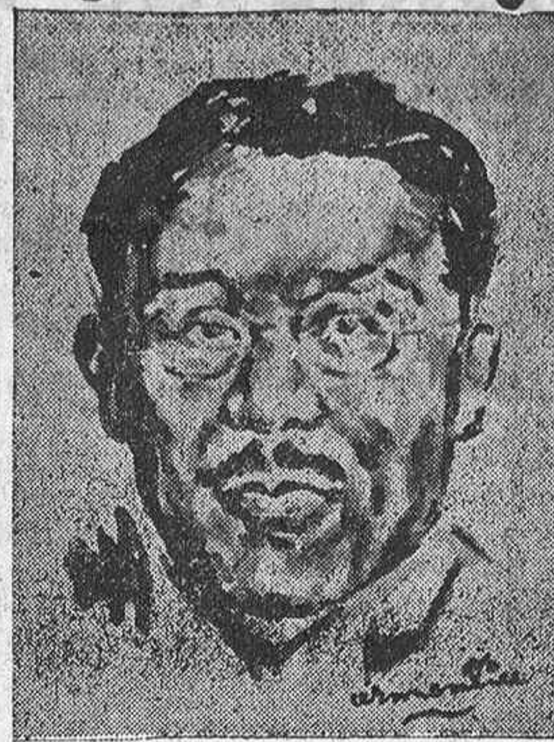
Hirota, ministro del Japón, que tan activamente ha llevado los asuntos del reconocimiento de la España Nacional, por el Imperio del Japón, que firmará el reconocimiento. (Dibujo de Armentia).

Se le concede la medalla de plata del jubileo en 1935. El 11 de agosto de 1936 se retira con una pensión del Estado.