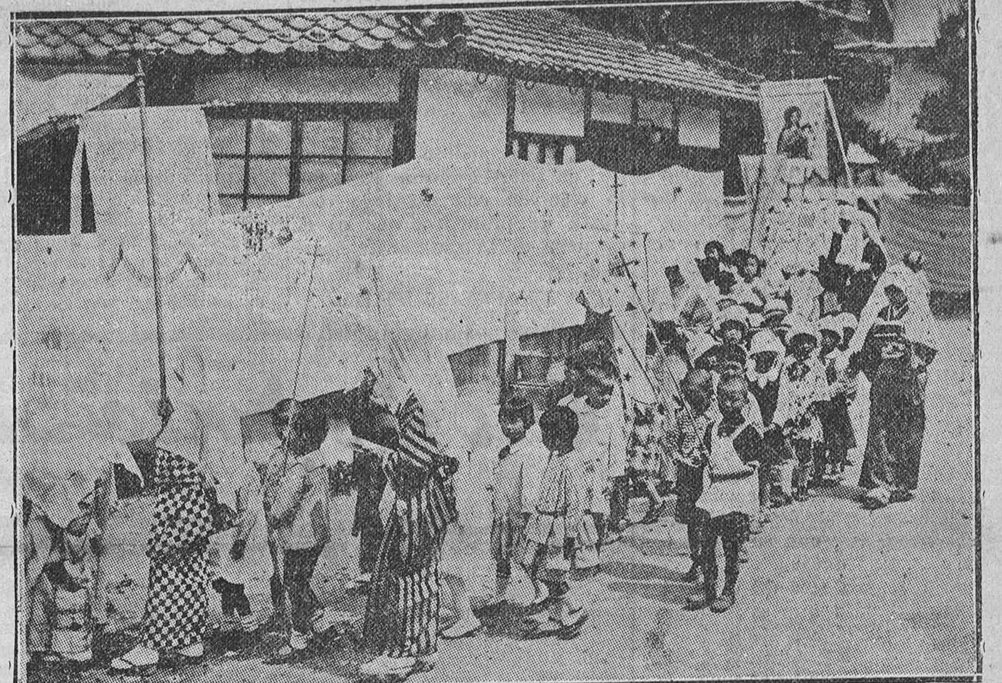
Una fiesta eucarística en un publicito japonés. El Catolicismo va adquiriendo un admirable desarrollo en la gran nación nipona, cuyo Emperador reconocerá al Gobierno del Generalísimo.