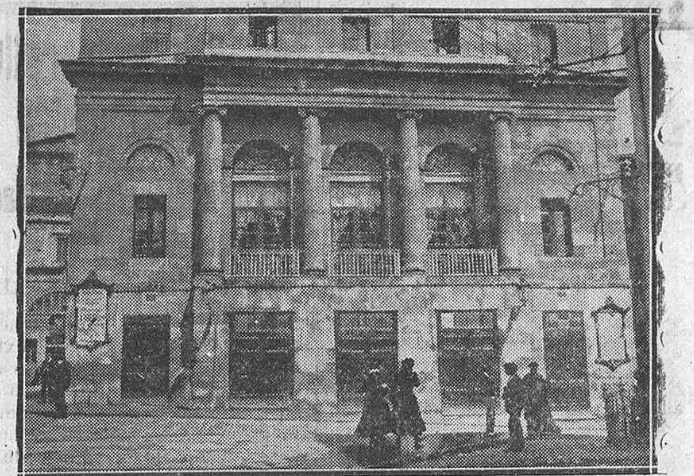
En el lugar que hoy ocupa el edificio del Banco de España se hallaba hace años el Teatro Principal. En este mes se cumplen los 23 años que un terrible incendio hizo desaparecer el severo edificio que hoy reproduce nuestro fotograbado

Meritorio para oficina se precisa. Razón: Esta Administración