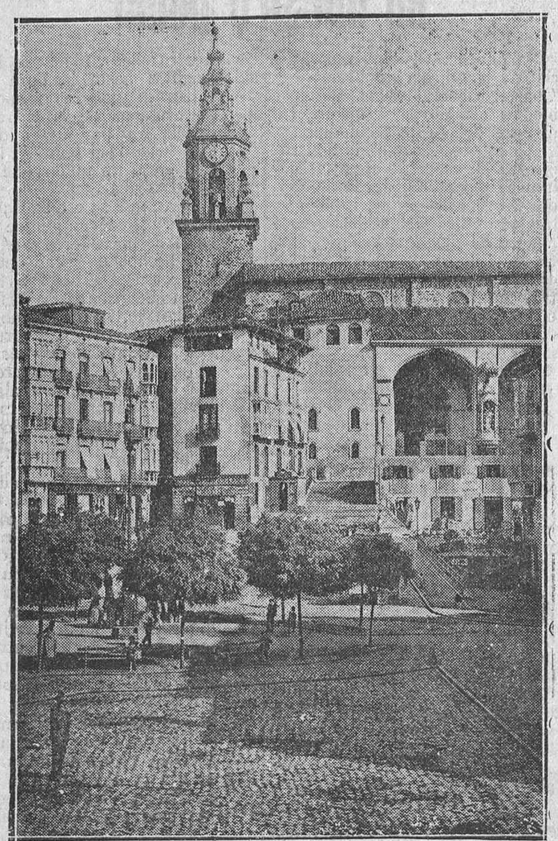
La Plaza de la Virgen Blanca o Mentirón a principios de este siglo

El Teatro Principal. Una madrugada de agosto hace 23 años, desaparecía entre las llamas