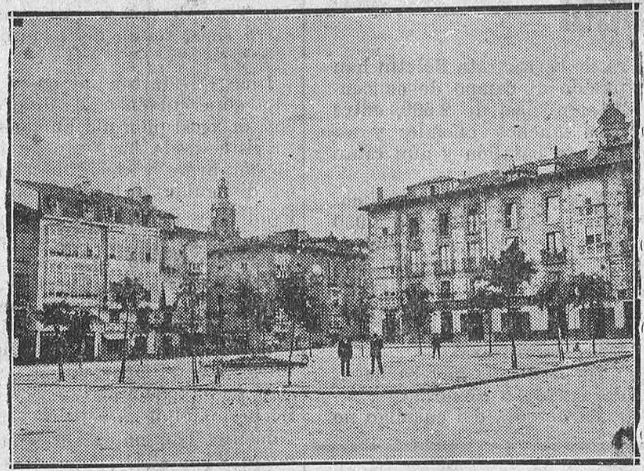
La desaparecida Plaza de Bilbao, en cuyo lugar se levanta hoy el magnífico edificio de Correos y Telégrafos

humor—para nosotros tiene algo de recordatorio, patriótico y sentimental que puede borrar lo que tenga de contrario a la estética y buen gusto arquitectónico. UN RECUERDO A LA PLAZA DE BILBAO Placita recoleta, con sus falsas acacias de exorno triste y melancólico. Era esta una de las Plazas vitorianas, como esas muchas que no tienen razón de existencia y que andando el tiempo han venido a edificarse sobre sus solares. Nuestro recuerdo de hoy es para esa plaza sin bancos, que es tanto como decir sin amor; desaparecida—aun cuando su rotulación exista—y en la que se alza el edificio de Comunicaciones (Correos y Telégrafos),