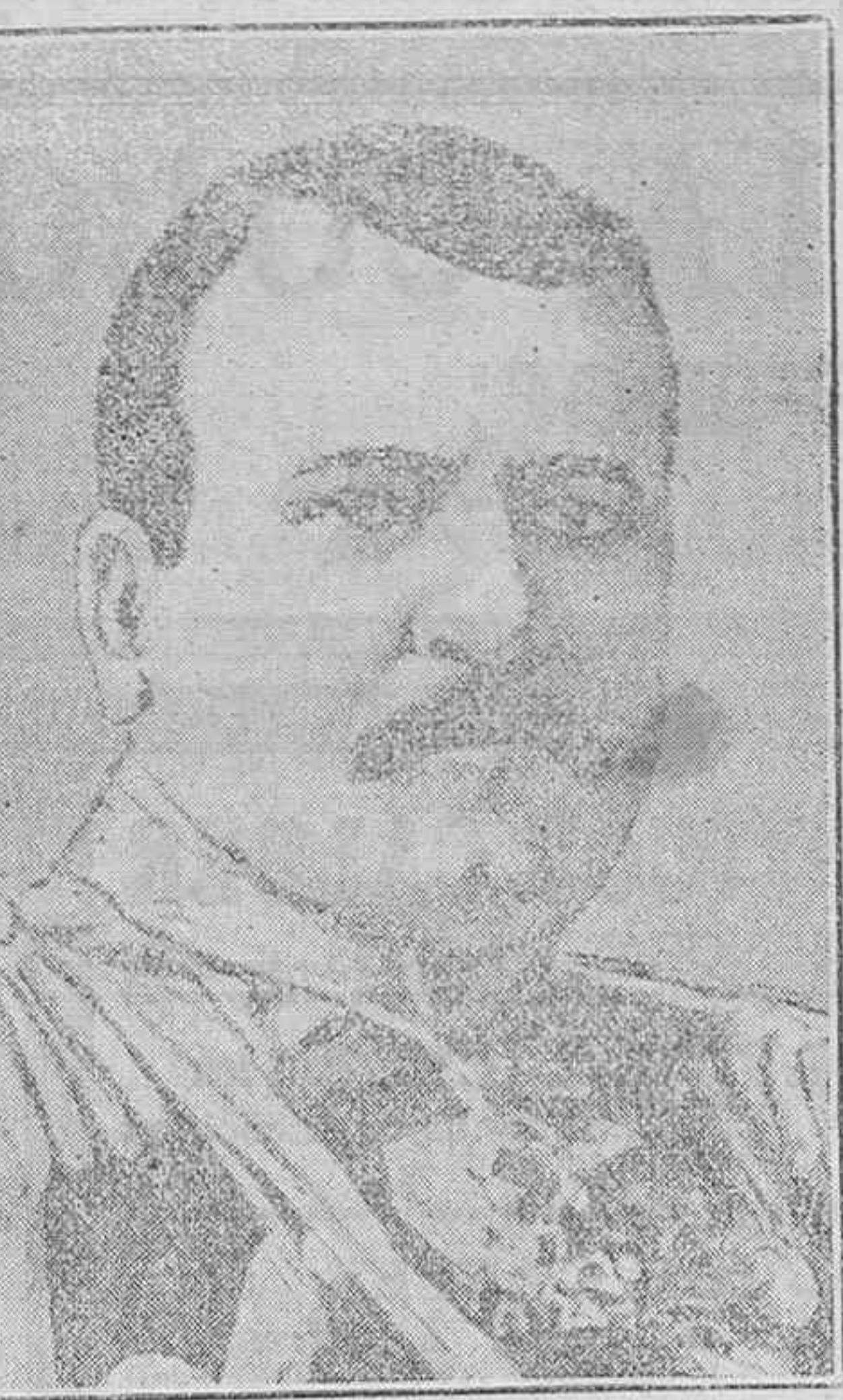
El general Radko Dimitrieff, el vencedor de Kirkilissé, que entró a formar parte del ejército ruso. Ha obtenido importantes victorias en Galitzia, al frente de sus tropas

Con Echagüe El presidente ha despachado en su