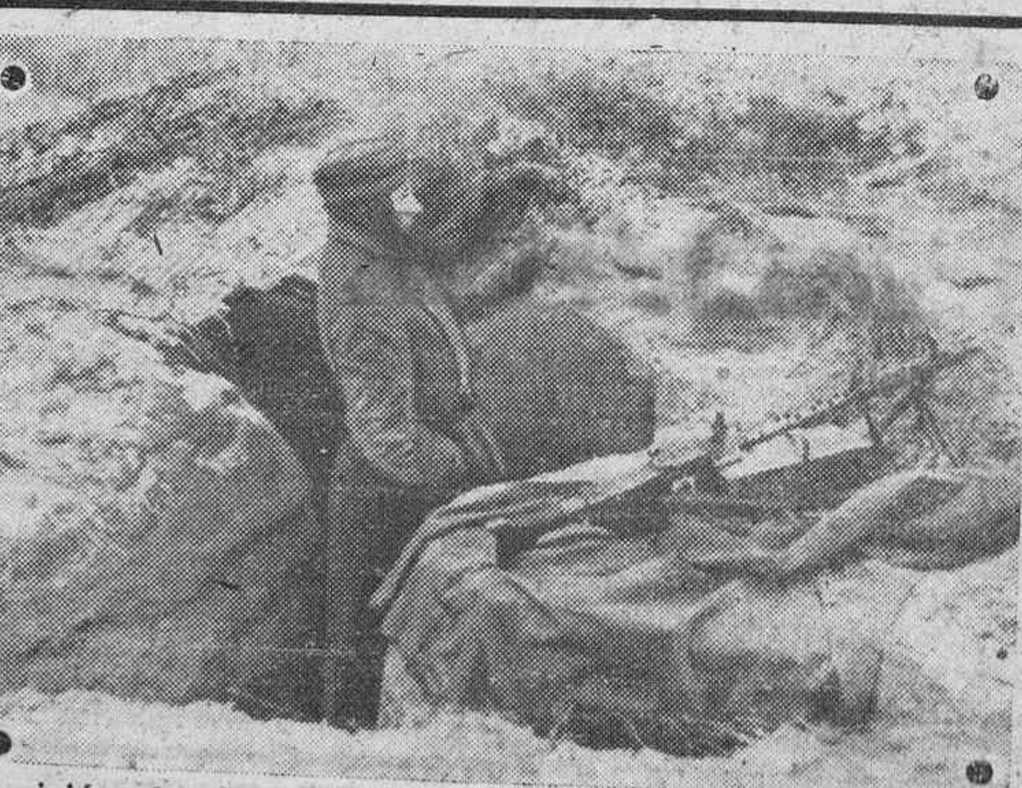
Posición de ametralladora alemana en el sector norte del frente Este. La nieve nos indica la llegada del invierno.