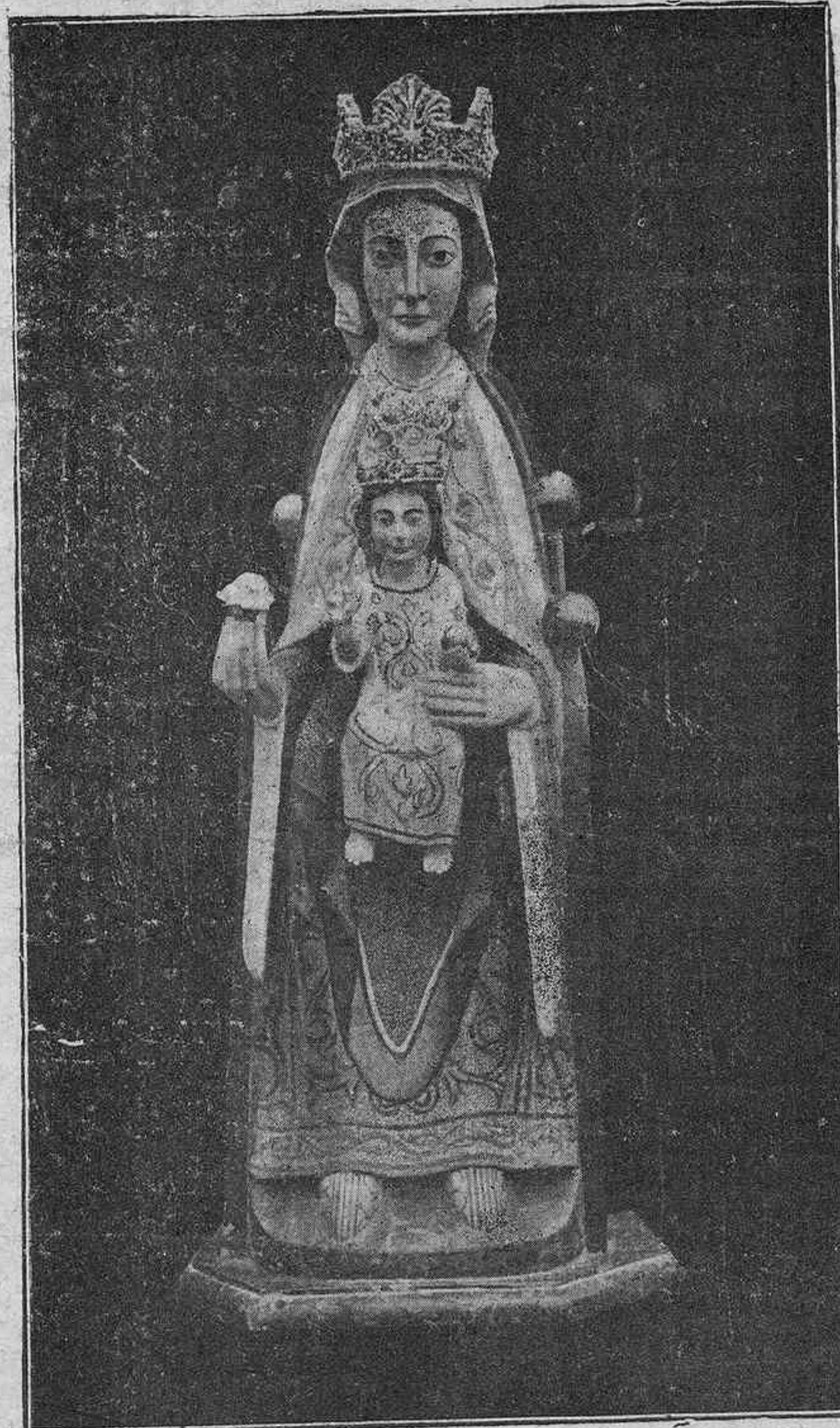
La histórica Imagen de Santa María de Estíbaliz que desde mañana presidirá en Vitoria el magno triduo de su Patronato

REPARACIONES RAPIDAS Moraza, 7 Correría, 187