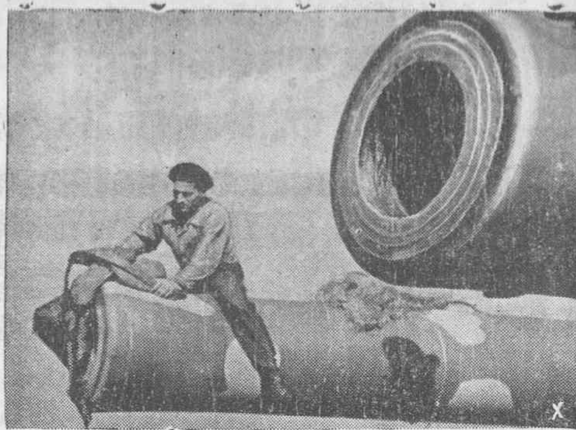
Baterías pesadas de costa de la defensa italiana del Mediterráneo. Un artillero se dispone a limpiar una de las grandes bocas.

Con una velada celebró este Centro parroquial de Acción Católica su homenaje al Papa. En la misma intervi-