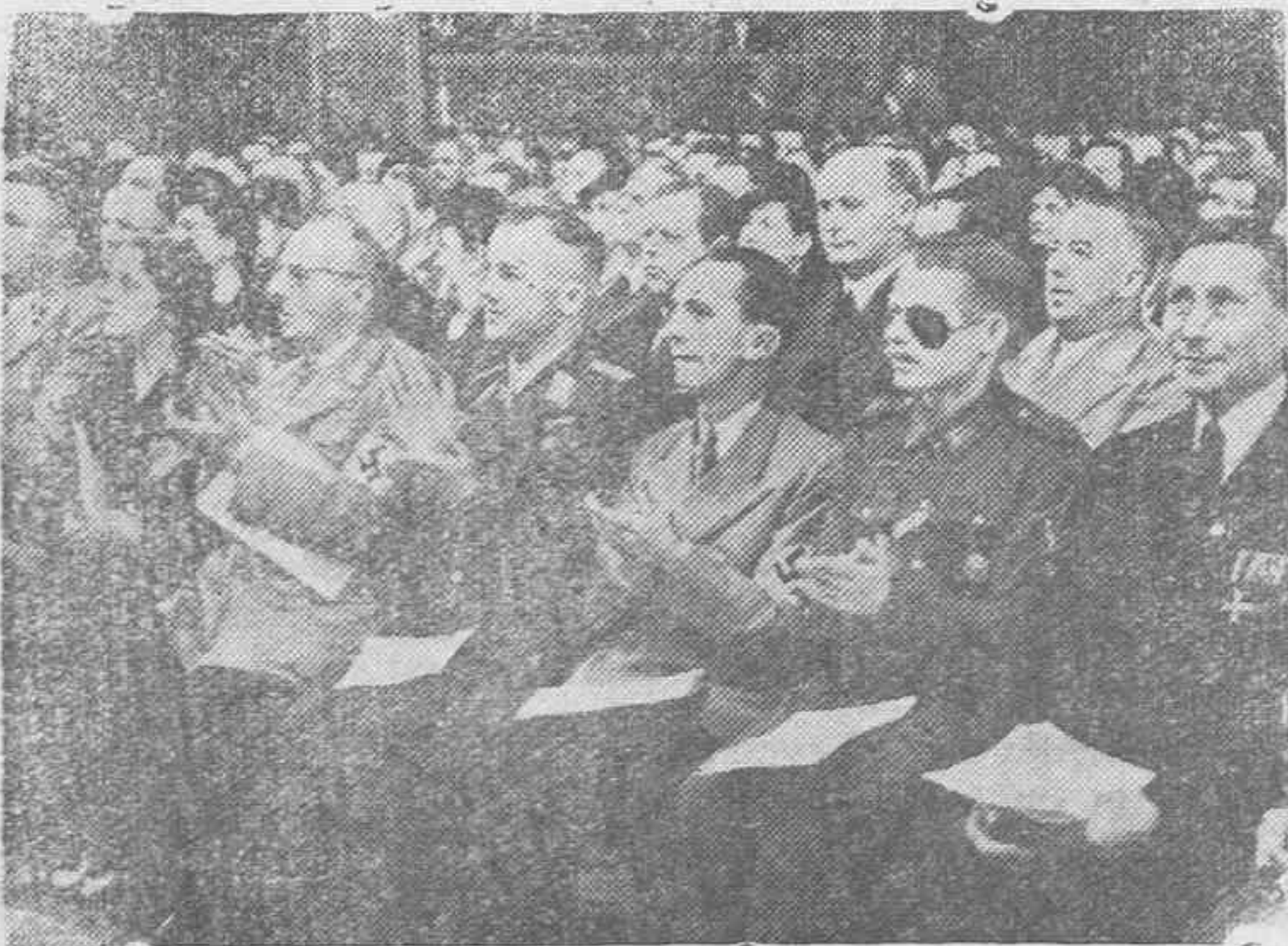
El ministro Goebbels durante el concierto de la Filarmónica de Berlín en honor del Führer el día de su 53 aniversario. Antes del concierto el Dr. Goebbels dirigió un discurso a los obreros, en el que hizo patente la fidelidad de Alemania al Führer.

EMPRESAS! Si empleáis permanentemente a más de diez trabajadores o carentes de este requisito, tenéis de capital social cincuenta mil pesetas o más, deberéis pagar directamente a vuestros productores el Subsidio Familiar del mes de abril.