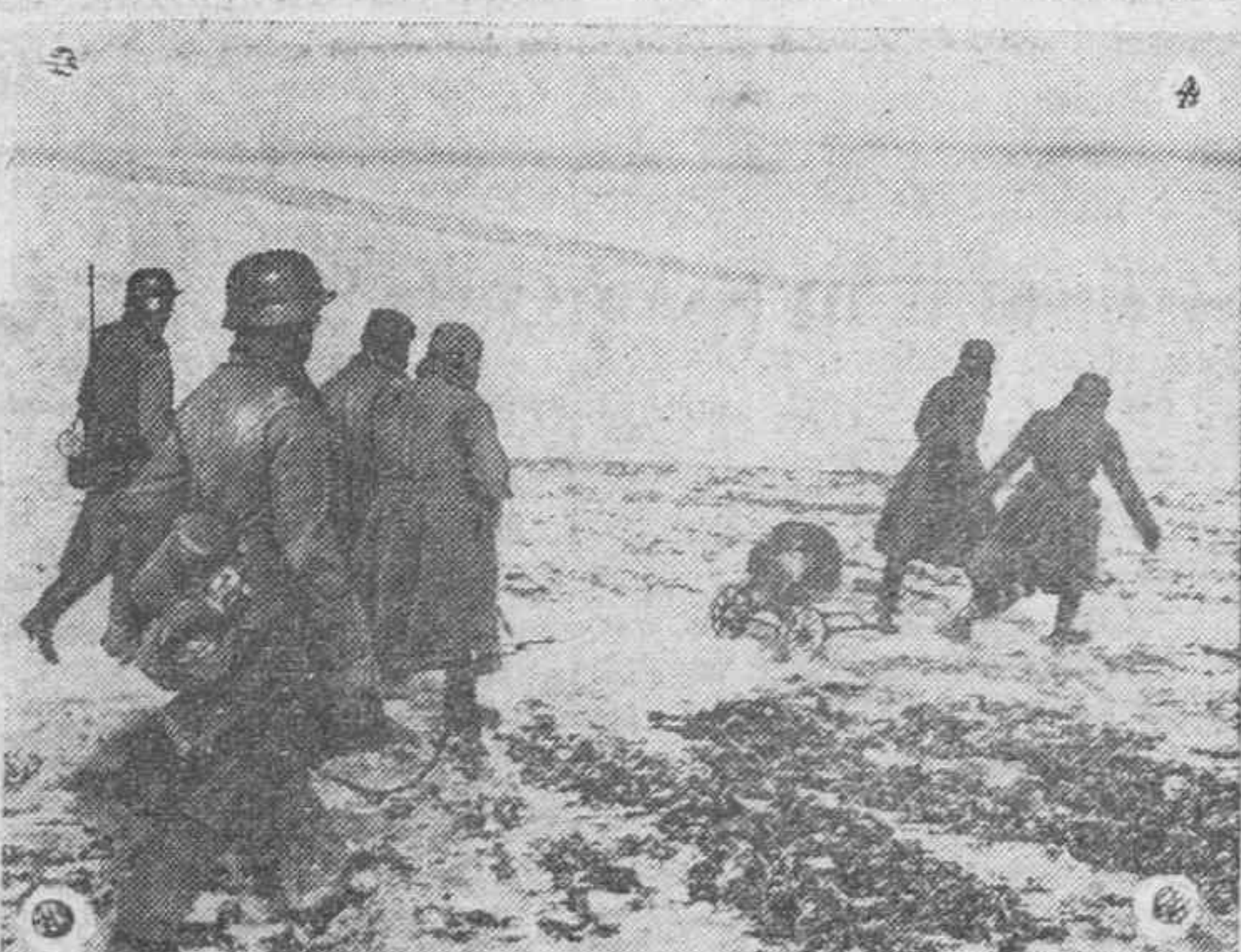
Un pelotón alemán de exploración ha capturado a unos soldados soviéticos y una ametralladora, con lo que vuelven victoriosos a su campamento.

La invitación comprende un jefe u oficial, un suboficial y tres de tropa, siendo libre de todo gasto y llevando consigo la asignación de una cantidad determinada, según la categoría, para los gastos particulares.—Cifra.