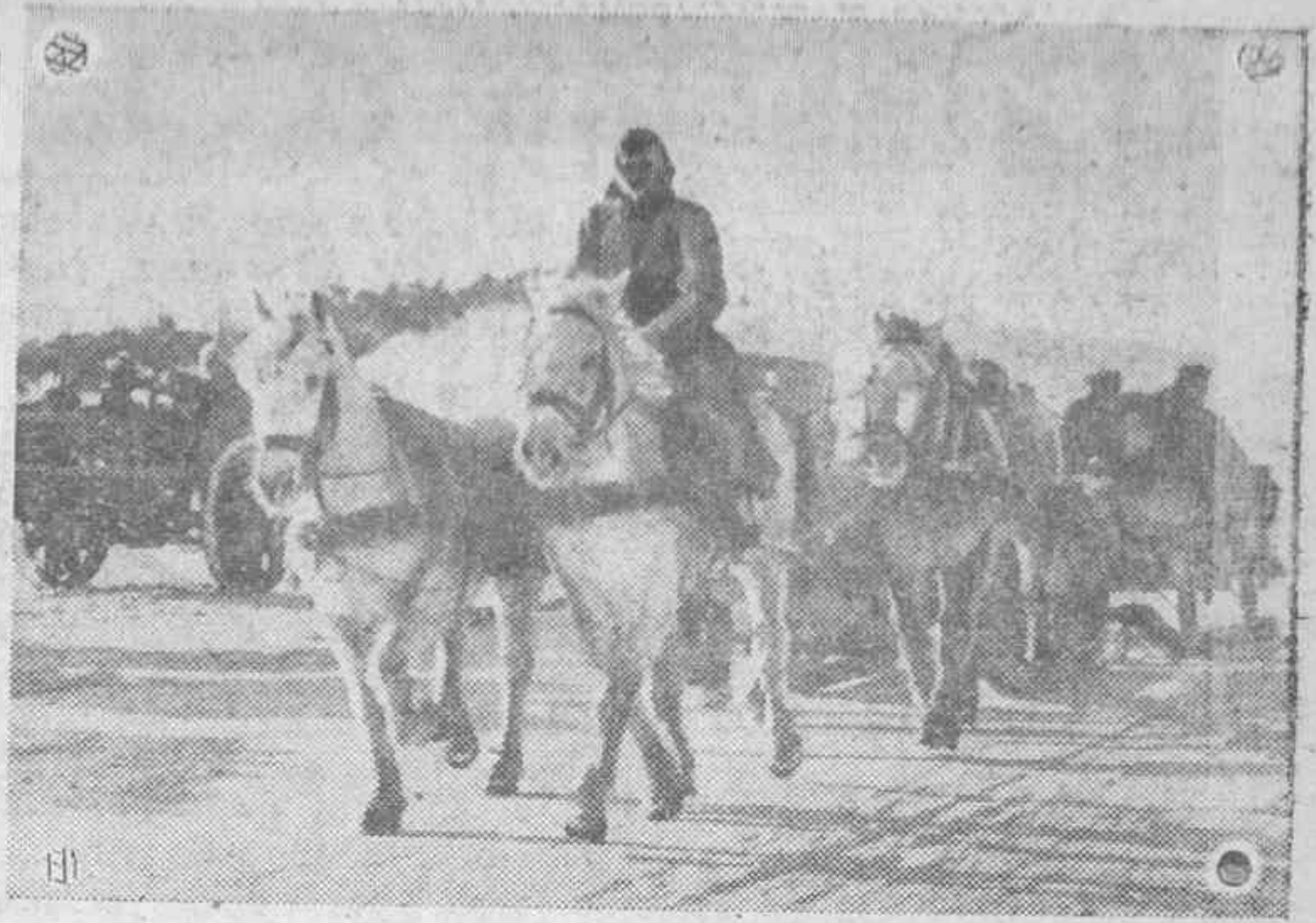
Piezas de artillería alemana arrastradas por caballos como en pasadas guerras. El frío de Rusia que hieló los motores obliga a estas vueltas al pasado.