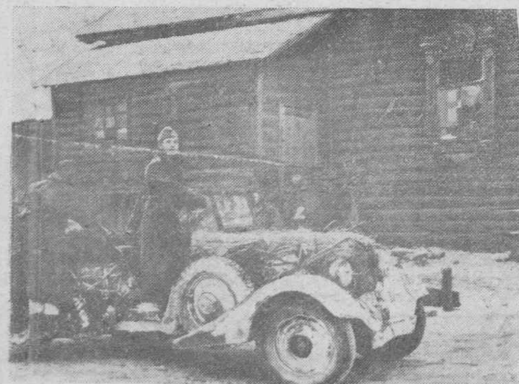
Un coche militar alemán hace un alto en una aldea rusa para proveerse de combustible en su marcha hacia uno de los frentes con órdenes del Alto Mando.

Lectores: Haced vuestras compras y solicitud los servicios de los anunciantes de este periódico.