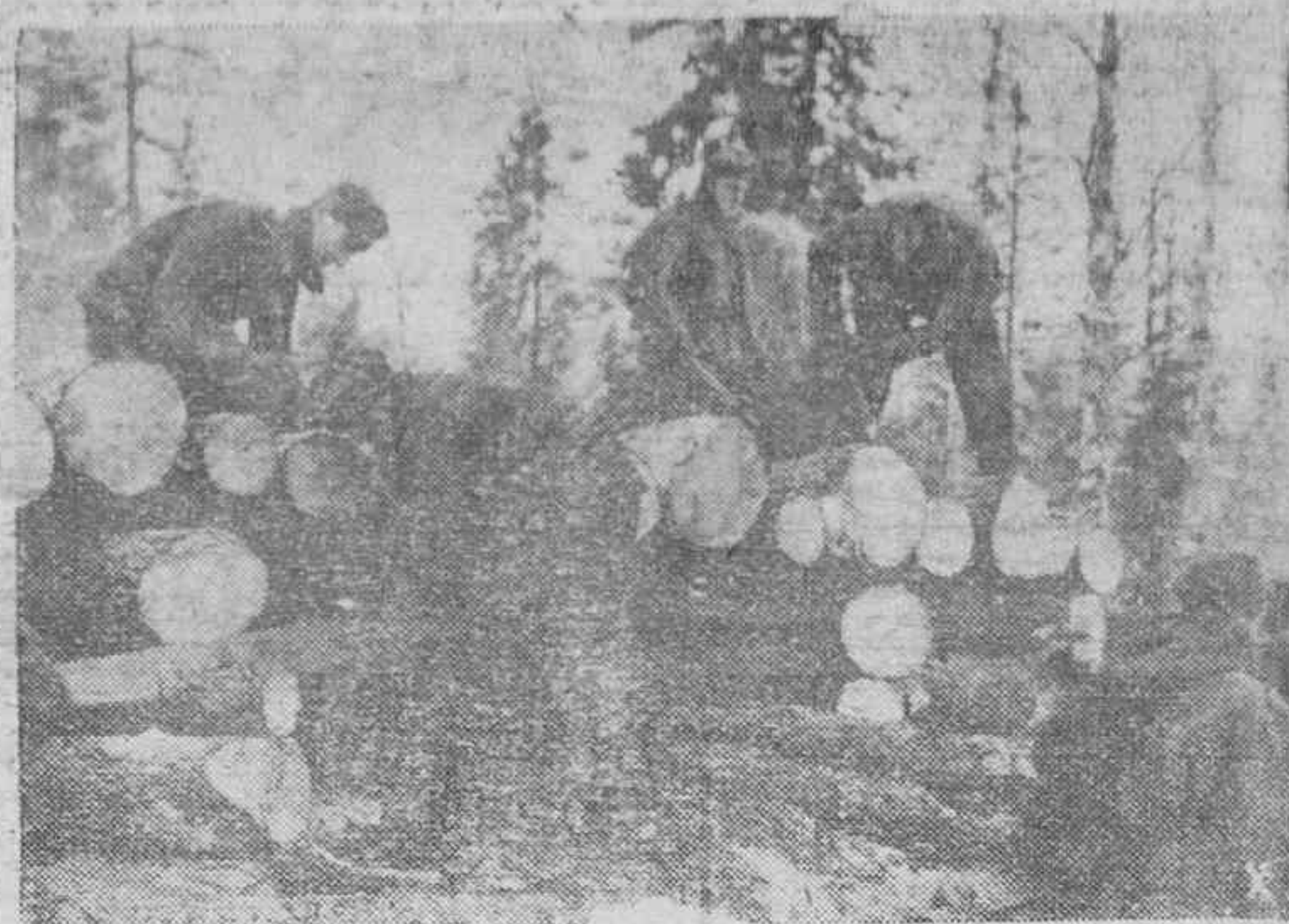
En sus posiciones de invierno del frente Oriental, las tropas alemanas construyen refugios, hasta que con la llegada de la buena estación se inicien las finales operaciones que han de traer la derrota del bolchevismo.

Lisboa.—El presidente del Consejo, Oliveira Salazar, ha recibido al ministro de Alemania von Hoyningen-Huene.—Efe.