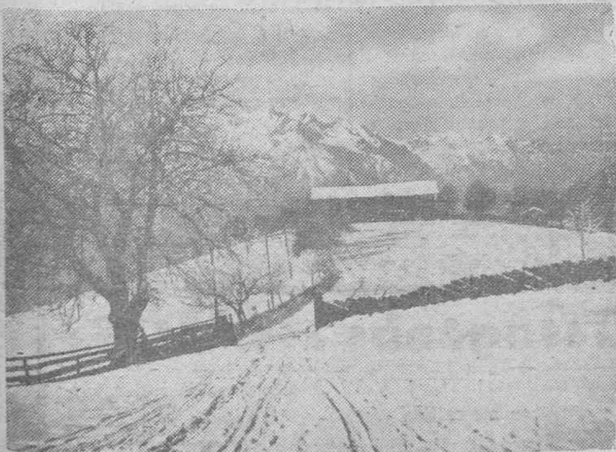
Este paisaje nevado despierta cierto aire de paz que nos hace desechar la idea de un frente ruso. Uno de los clásicos refugios de las montañas alemanas es lo que nos representa la foto.

Intransigentes y fanáticos, con fe inquebrantable y esperanza ciega, el Movimiento se nos muestra en forma ascensional para llevar a cabo su obra cumbre revolucionaria, animados por eternos impulsos en una unidad rectora y conductora.